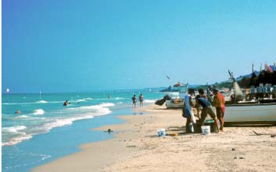
Fischer am Strand von Giulanova