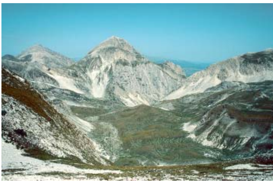
Einsam und wild: der Gran Sasso d'Italia