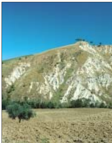
Die Calanchi bei Atri

Die Küste besteht vorwiegend aus feinen, teilweise sehr breiten Sandstränden. Die Qualität des Wassers und der Badestrände lässt nichts zu wünschen übrig, ganz im Gegensatz zum hartnäckig kolportierten Image von einer verunreinigten Adria . Zum wiederholten Male wurden 2005 zehn Strände der Abruzzen mit „Blaue Flaggen“ ( Bandiere Blu ) ausgezeichnet, dem strengen Gütesiegel für saubere, intakte Küstenabschnitte und beste Wasserqualität.