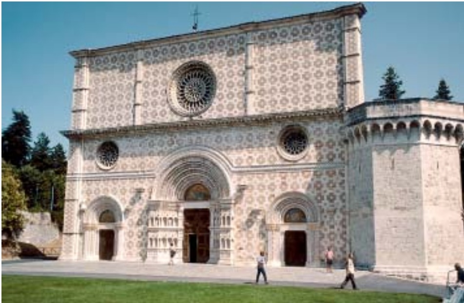
Geschichtsträchtigt: Chiesa Santa Maria di Collemaggio in L'Aquila