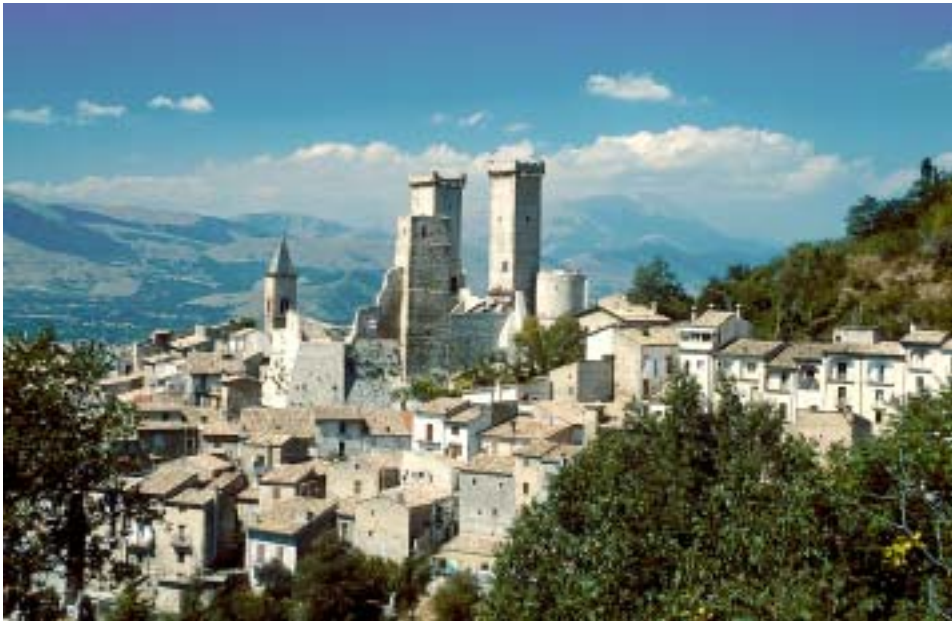
Malerisch: die Kulisse von Pacentro am Rand der Majella