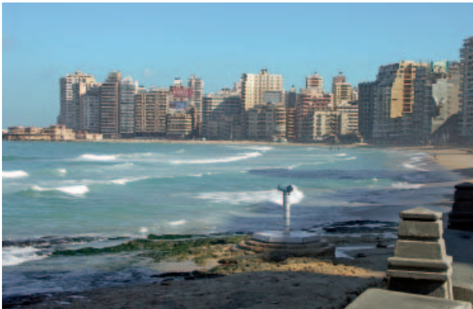
Strand und Skyline von Sidi Bischr, Alexandria