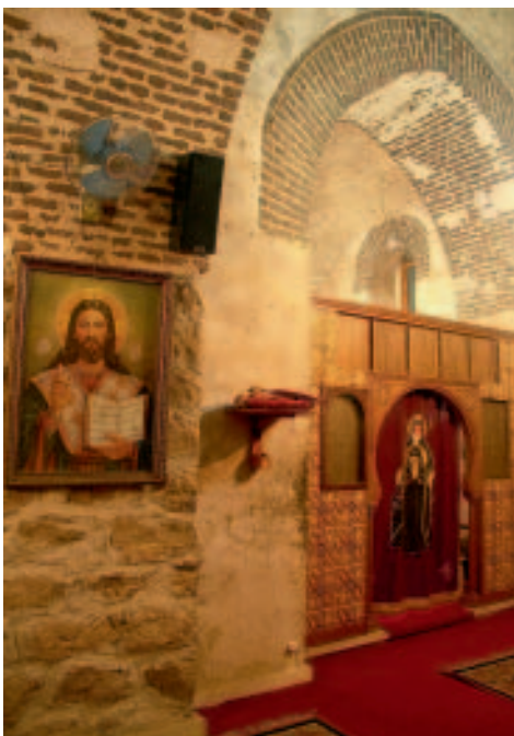
Kapelle im Kloster des Anba Bischoi