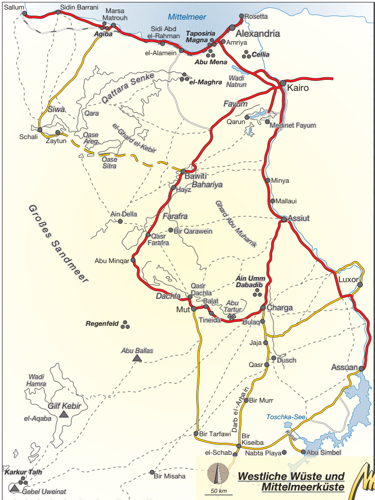
Von Kairo nach Alexandria Karte S. 383