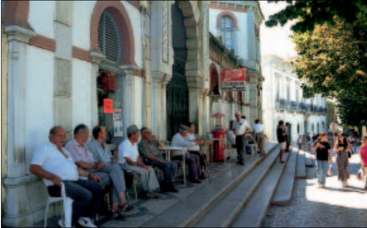
Die Markthalle von Loulé im neo-maurischen Stil – Treffpunkt der Veteranen

mingpool auf der Dachterrasse. DZ inkl. „deutschem“ Frühstücksbuffet saisonabhängig 50–78 €. Praça Manuel de Arriaga, (665), ☎ 289413094, 📧 289463177, www.loulejardimhotel.com.