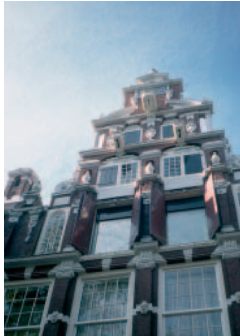
Hier wohnte der „Heineken des 17. Jahrhunderts“ (Bartolotthuis)

Das kleine, hinsichtlich seiner Exponate eher unspektakuläre Museum hütet und erforscht die Schriften und persönlichen Hinterlassenschaften Dekkers und lädt in dessen Wohnzimmer ein. Sein sympathischer Kurator führt nicht nur durch das Museum, sondern nach Absprache auch auf Multatulis Spuren durch Amsterdam.