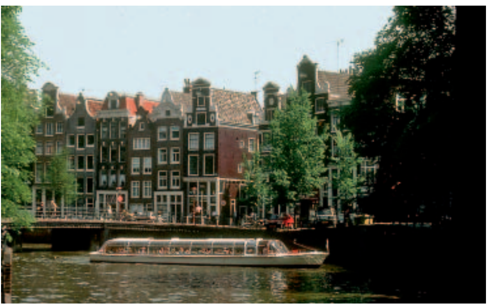
Die zweitbeste Grachtenadresse: Keizersgracht