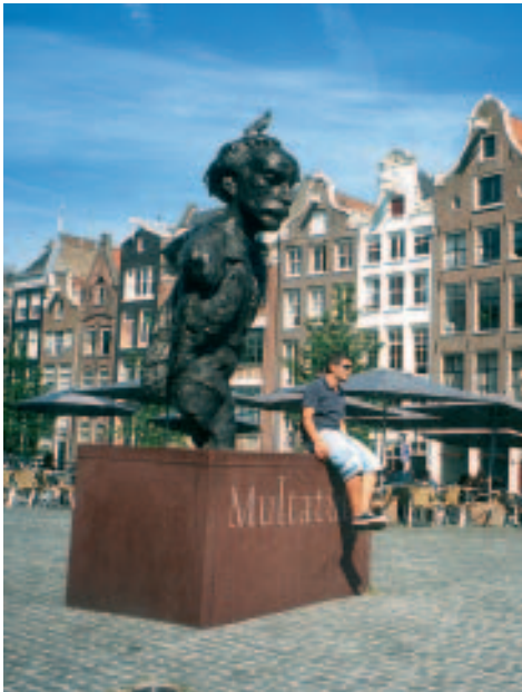
Späte Ehre: Multatuli-Denkmal

An der Leidsegracht angekommen, geht es über die Keizersgracht wieder in Richtung Westermarkt, wobei unterwegs ein Besuch in Amsterdams erstem Fotografiemuseum → Huis Marseille oder ein Sprung (via Huidenstraat) zum → Bijbels Museum an der Herengracht empfohlen seien. Gleich nebenan erforscht und dokumentiert übrigens das 1945 gegründete Nederlands Instituut voor Oorlogsdocumentatie die Geschichte des Zweiten Weltkriegs und der deutschen Besatzung. Das Institut residiert im schlossähnlichen historischen Domizil eines Tabakhändlers, Baujahr 1890, von dem wir ans Westufer der Keizersgracht zurückkehren. Dort verblüfft nach wenigen Metern nordwärts der ebenfalls palastartige Bau des altherwürdigen Kulturhauses → Felix Meritis , in dem schon seit Ende des 18. Jh. Wissenschaft und schöne Künste gepflegt werden. Von dort könnte man via Westermarkt und Radhuisstraat zum Dam zurückkehren oder einen beschaulichen Einkaufsummel in den „ Negen Straatjes “ (Neun Sträßchen) anschließen, womit die von hübschen kleinen Geschäften, Cafés und Restaurants gesäumten Verbindungsstraßen zwischen den vier großen Grachten, namentlich Ree-, Beeren- und Runstraat, Harten-, Wolven- und Huidenstraat, Gasthuismolensteeg, Oude Spiegelstraat und Wijde Heissteg, gemeint sind.