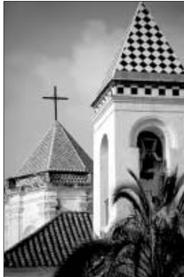
Marbella, abseits des Trubels

Orientierung: Von der Altstadt abgesehen, ist der Unterschied beispielsweise zu Fuengirola gar nicht so groß. Auch in Marbella entlastet eine Ortsumgehung das Zentrum vom Verkehr, und auch hier führt die Hauptstraße durch eine Hochhausschlucht, wie sie entlang der gesamten Costa stehen könnte. Landeinwärts liegt der Ortskern um den lauschigen „Orangenplatz“ Plaza de