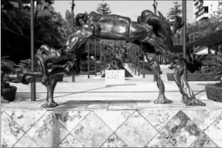
Man gönnt sich ja sonst nichts: Dalí-Skulptur an der Avenida del Mar

auch zum Verkauf stehen. Es ist eines von nur zwei Museen dieser Art in Spanien, für Liebhaber sicher den Weg wert.