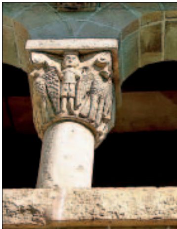
Uralt: Kapitell vor dem Kloster Pedralbes

Pavellons Güell: 1884–1887 errichtete der junge Gaudí für seinen Mäzen Güell dieses Gestüt mit Reitbahn und Garten. Es liegt an der an Av. de Pedralbes 7 und ist als Centre de Modernisme (Führungen Fr–Mo 10.15 Uhr/Englisch, 11.15 Uhr/Katalanisch, 12.15 Uhr/Englisch und 13.15 Uhr/Spanisch; evtl. am Eingang klingeln; 6 €) zugänglich. Der Eingangskomplex besteht aus zwei teilweise mit Keramik verkleideten Ziegelbauten (Pfortnerhäuschen und Hauptgebäude), die durch ein Tor miteinander verbunden sind; an einer Säule zeigt ein stilisiertes „G“ das Initial des Besit-