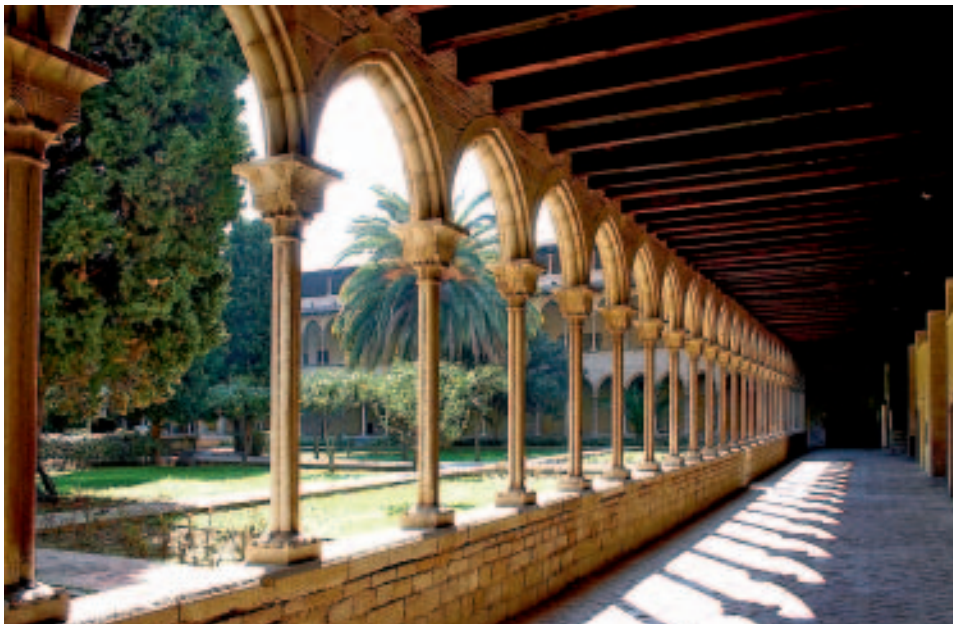
Prachtvoller Kreuzgang: Monestir de Pedralbes