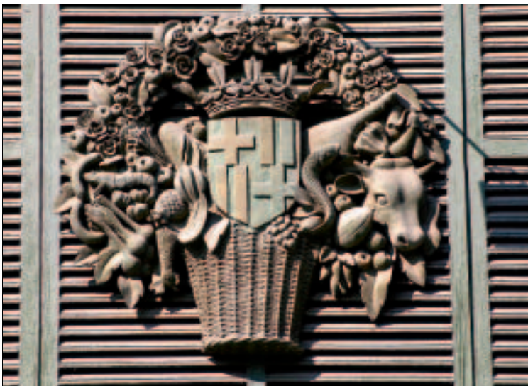
Symbol der Fülle: Dekoration am Mercat de Sarrià

Pedralbes Centre (5) , ein etwas kleineres Center, das auf seinen vier Etagen gleichwohl eine gute Auswahl an Kleidung (Mango etc.), Schuhen (Farrutx), Geschenkartikeln und ähnlichem offeriert. Avinguda Diagonal 609–615, neben dem Corte Inglés. www.pedralbescentre.com .