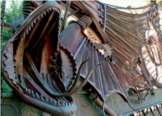
Vorsicht, bissig: Drache an Gaudís Pavellons Güell