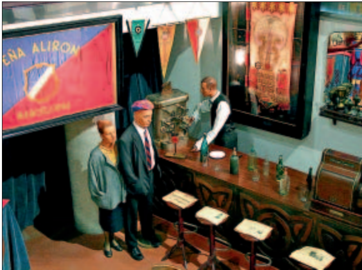
Nostalgisch: nachgestellter Fanclub im Museu F.C. Barcelona

Stadtverkehr, Öffnungszeiten, Tickets Von der Metro-Station Palau Reial ist das Museum am besten über den Ausgang Sortida Facultat de Biologia zu erreichen, dann gleich links in den Carrer Martí i Franquès und bergab in Richtung der gut sichtbaren Kuppel des „Miniestadi“; am Ende links. Das Museum öffnet von etwa Mitte April bis Mitte Oktober Mo–Sa 10–20 Uhr (Rest des Jahres 10–18.30 Uhr), So ganzjährig 10–14.30 Uhr. An Tagen mit Spielbetrieb ist grundsätzlich nur bis 13 Uhr geöffnet, die Stadiontour dann nicht möglich. Eintritt inklusive Stadiontour 17 € (die früheren