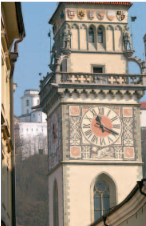
Rathausturm aus dem späten 19. Jahrhundert

Nachdem der alte Turm (seinerzeit Bürgergefängnis) wegen angeblicher Baufälligkeit 1811 abgerissen worden war, errichtete man von 1889 bis 1891 den heutigen im Stil der Neugotik konzipierten Rathausturm . Die Fassadenmalereien stammen ursprünglich aus dem späten 15. Jh. und wurden von dem eigens aus Salzburg bestellten Künstler Rueland Frueauf d. Ä. vollendet, dem auch die Ausmalung des Rathaussaals zugeschrieben wird. Im Zuge einer Fassadenerneuerung im Jahr 1922 misslang leider die Restaurierung der alten Fresken; Josef Hengge aus Kempten malte sie in freier Nachschöpfung neu. Abgebildet sind Kaiser Ludwig der Bayer und vier Fürsten, die sich um das Wohl der Stadt bemüht haben wollen. Auch die Sgraffittomalereien am Uhrengeschoss des Turms stammen aus diesem Jahrhundert. Sie ersetzen die Originaldarstellungen des legendären Passauer Historienmalers Ferdinand Wagner . Zwischen Turm und Saalbau wurde um 1900 ein Verbindungstrakt gesetzt, der auf der Höhe des Rathaussaals eine Loggia mit dekorativer Maßwerkbrüstung besitzt. Am Turm erinnert eine Tafel an Sissis Hochzeitsreise und eine Übersicht an die folgenschwersten Hochwasser der Donau.