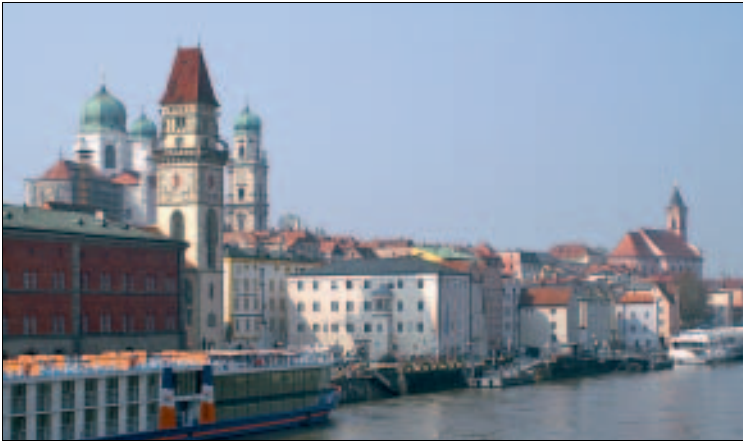
An der Passauer Donau: Altes Rathaus (mit Turmuhr) und dahinter die Türme des Stephansdoms; rechts St. Paul