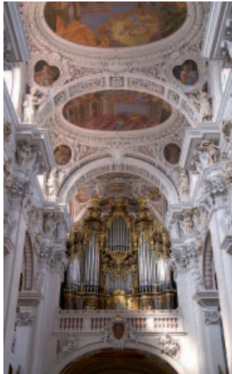
Die größte Kirchenorgel der Welt im Passauer Dom