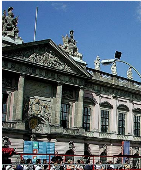
Das Zeughaus Unter den Linden ist ein bedeutender Barockbau

An der Ostseite des Ende der 1990er-Jahre wieder zum Park umgestalteten Lustgartens steht der massive Klotz des Berliner Doms, dahinter das Radisson-SAS-Hotel Dom-Aquarée mit seinem spektakulären Aquarium „Aquadom“. Direkt am Spreeufer buhlt das kleine DDR-Museum um Besucher, während auf der anderen Seite der Karl-Liebknecht-Straße, der Verlängerung der Linden, auf dem Gelände des ehemaligen Palasts der Republik ein provisorischer Park mit Holzbohlen-Wegen und Audio-Installationen angelegt wurde. Nebenan lockt die Temporäre Kunsthalle zu einem Besuch (s. S. 150). Etwas zurückversetzt ist das ehemalige Staatsratsgebäude zu sehen, das seit 2005 eine private Manager-Hochschule beherbergt.