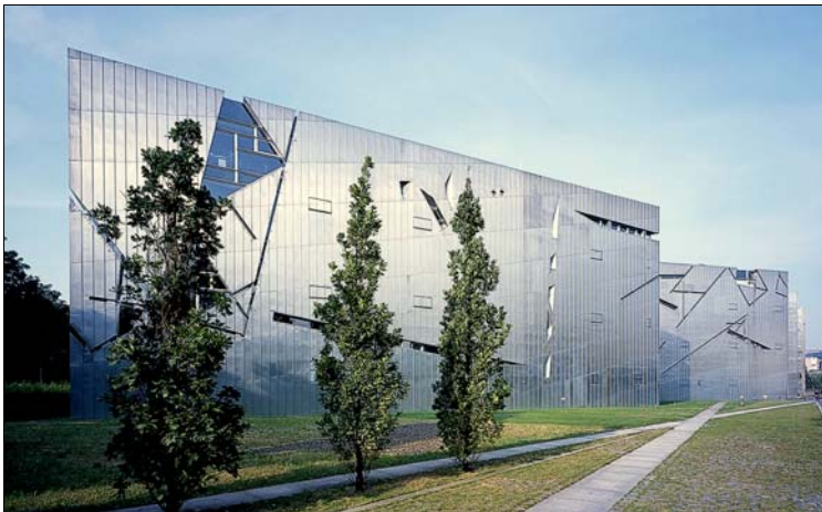
Spektakulär – die Architektur des Jüdischen Museums

Richtung Osten sind das ehemalige Postfuhramt und die Neue Synagoge Sehenswürdigkeiten an dieser Straße, in der fast jedes Haus ein Restaurant oder eine Kneipe beherbergt. Im Sommer steht hier Tisch an Tisch und es wird vor allem am Wochenende bis in die Morgenstunden gefeiert. Für Kinder bietet in den Sommermonaten das Kinderbad Monbijou einen erfrischenden Abschluss dieses Rundgangs.