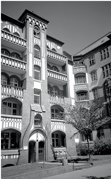
In der Versöhnungs-Privatstraße

SPD hatte sich damals noch den Klassenkampf auf ihre Fahnen geschrieben). Die Anlage erstreckte sich über sechs Hinterhöfe bis zur Strelitzer Straße. Heute stehen nur noch drei Höfe, der schwer von Bomben beschädigte Rest, wie zum Beispiel das großartige Vorderhaus zur Hussitenstraße, wurde zum Teil sogar erst in den 1970er-Jahren abgerissen.