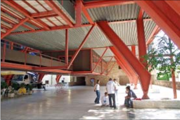
Bankfiliale, nach einem Entwurf von Michelucci

• Feste Im Rahmen des Festival di Musica Antica im Mai werden mehrere Konzerte im schönen Teatro dei Varii veranstaltet. www.comune.collevaldelsa.it