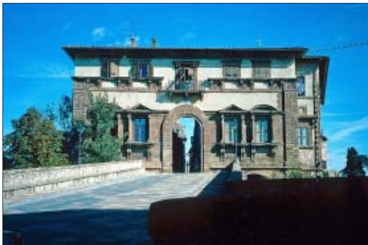
Palazzo Campana als Eingang zum Castello

15. Jh. In einem Nebengebäude an der linken Seite ist über dem Altar eine wunderschön bemalte Terrakotta-Gruppe aus dem 17. Jh. zu sehen: „Die Klagen über den Leib Christi“ des Volterranners Zaccaria Zacchi .