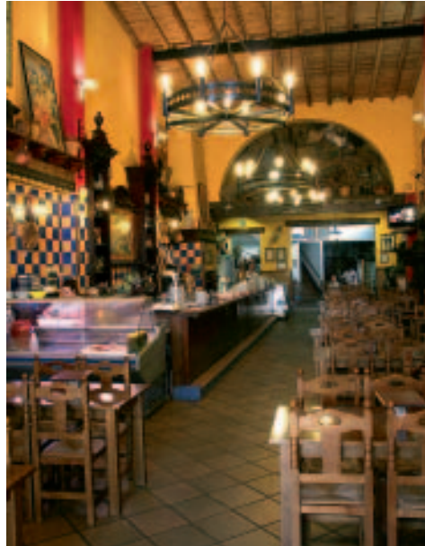
Gemütliche Atmosphäre: Bodegón Abuelo Curro in Bollullos

Ebenso auffallend sind die vielen Spanier und Ausländer, die Fotobjektive von der Größe eines Megaphons durch die Gegend schleppen: El Rocío, direkt am Rand des Feuchtgebiets Marismas del Rocío gelegen, gilt unter Ornithologen als einer der besten Plätze Europas zur Beobachtung der gefiederten Freunde. Ganz andere Passionen bewegen die Insassen der reichlich vertretenen Reisebusse, die am Ortsrand bei der Marienkirche parken. Sie wollen auch außerhalb der Pfingstzeit der Madonna ihre Aufwartung machen – an manchen Sonntagen werden Pilgergruppen aus ganz Andalusien im Stundentakt durch die Kirche und die dortigen Souvenirgeschäfte geschleust.