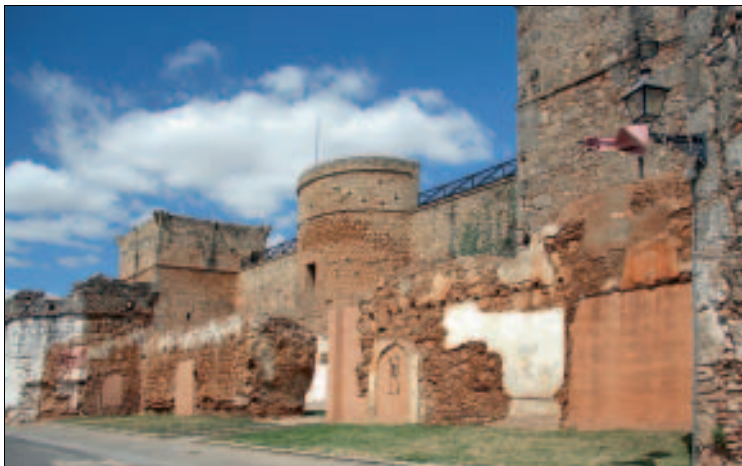
Erbe vieler Jahrhunderte: Nieblas Stadtmauern

dränge kommt also nicht auf. DZ etwa 30 €. C. Moro 3, ☎ 959 362080.