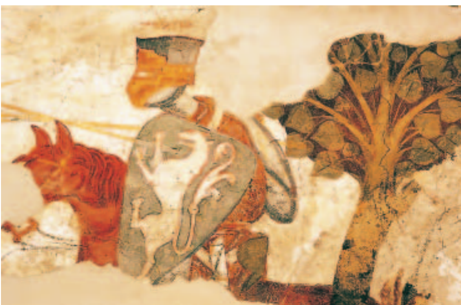
Mittelalterliches Fresko aus Burg Rodeneck – ein Ritter aus König Artus' Tafelrunde