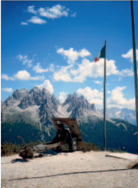
Monte Piana – Geschütze erinnern an den blutigen Dolomitenkrieg 1915–1918

1923 Verbot der deutschen Sprache als Unterrichtssprache an den Schulen Südtirols. Im ganzen Land entstehen illegale Notschulen. Alle öffentlichen Einrichtungen und Behörden dürfen ausschließlich in Italienisch verkehren. Im selben Jahr verbieten die faschistischen Behörden den Namen Tirol und ersetzen ihn durch das Kunstwort Alto Adige („Hochetsch“). Die kulturelle Identität der Südtiroler deutscher und ladinischer Sprache soll gebrochen werden, das Ziel ist die kollektive Italianisierung.