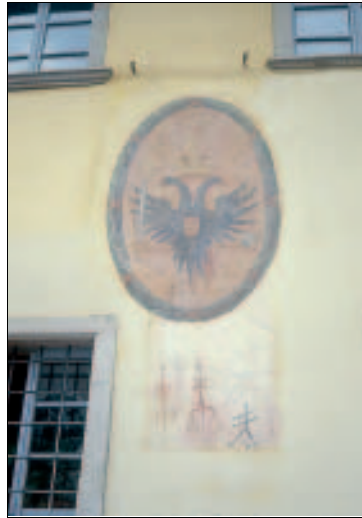
Habsburg und Tirol bestimmten die Geschichte der Dolomiten seit 1363

1914–1918 Erster Weltkrieg. 1915 tritt Italien auf Seiten der Alliierten in den Krieg ein, es kommt zu einem blutigen Gebirgskrieg zwischen Österreich und Italien. Stellungen in Höhen bis über 3000 m ziehen sich von der Lagoraig-Gruppe bis zu den Sextenern quer durch die Dolomiten. Die Orte im Frontbereich (z. B. Arabba) werden evakuiert und durch Geschützfeuer zerstört (z. B. Toblach). In der italienischen Volksgruppe wächst der innere Widerstand, zahlreiche Trentiner kämpfen für Italien. Von den Österreichern hingerichtete Irridentisti