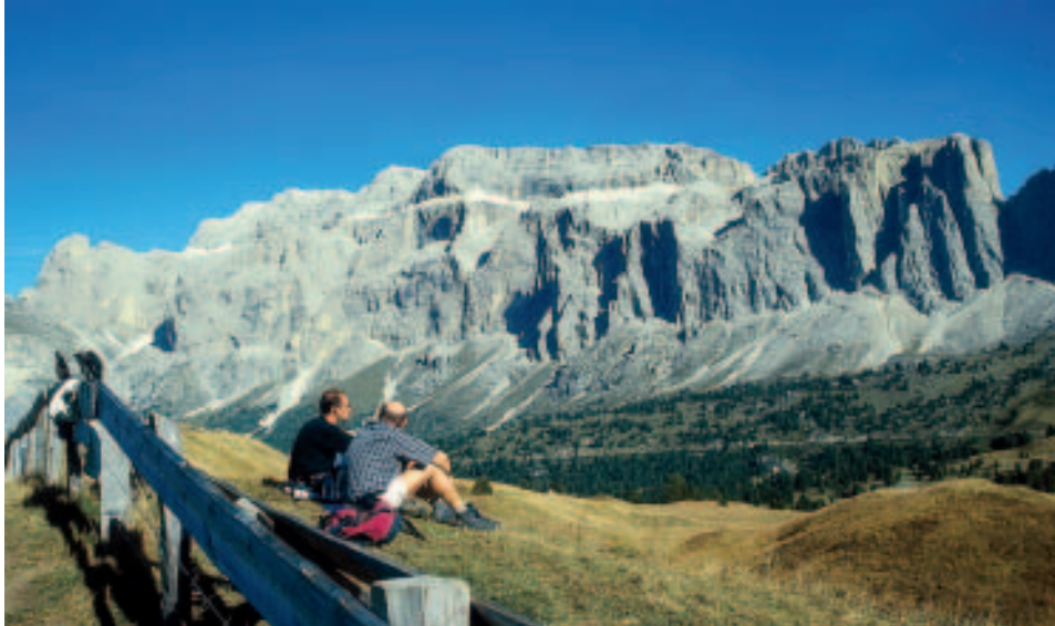
Prachtblick auf die Sella – die Bergsteiger sitzen auf einer Almwiese unter dem Langkofel