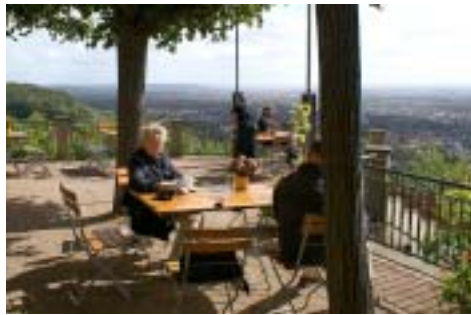
Den Ausblick gibt's gratis: Spitzhausterrasse

Gasthaus im Schloss Wackerbarth (3) , feines Restaurant des gleichnamigen Weingutes, das sich ganz bescheiden „Gasthaus“ nennt (diese Form des Understatement ist durchaus im Einklang mit anderen schicken Restaurants, die sich augenzwinkernd diese oder eine ähnliche Bezeichnung geben, wie z. B. das der Starköchin Sarah Wiener in Berlin). Wackerbarthstr. 1, Mo-Fr 12-22 Uhr, Sa/So 10-22 Uhr, ☎ 8955200, kontakt@schloss-wackerbarth.de .