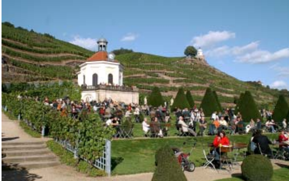
Weinbergfest am Schloss Wackerbarth