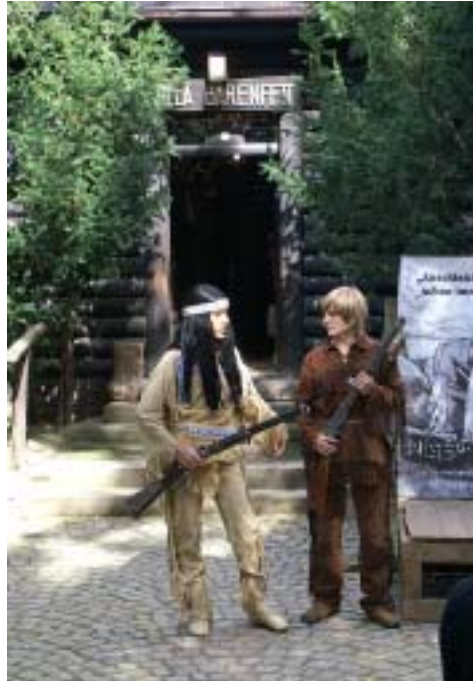
Das sind doch ...? Karl-May-Szene vor der Villa Bärenfett

Die Weinberge über Radebeul tragen den Namen Lößnitz nach den alten