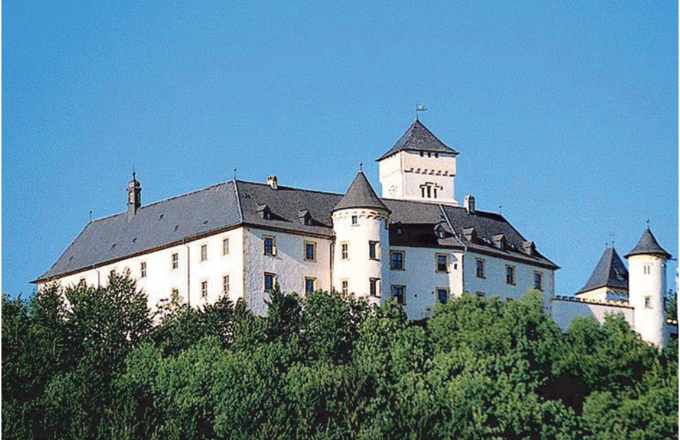
Burg Greifenstein – Familiensitz der Stauffenbergs