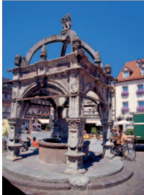
Renaissancebrunnen am Marktplatz

Burgruine Trimburg: Einige Kilometer flussaufwärts befindet sich hoch über dem Tal die romanische Ruine Trimburg, der Stammsitz der Herren von Trimberg. Eigentlich besteht die Anlage aus drei hintereinander liegenden Burgen, von denen die mittlere Hauptburg am besten erhalten ist. Die Trimburg verfiel, als sie 1803 auf Abbruch verkauft wurde. In der unterhalb der Burg gelegenen Ortschaft Trimberg wurde im Jahre 1200 Süßkind von Trimberg , der wohl einzige jüdische Minnesänger, geboren.