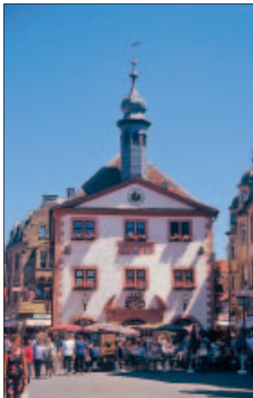
Das alte Rathaus: Von 1577–1929 die „Machtzentrale“ der Stadt