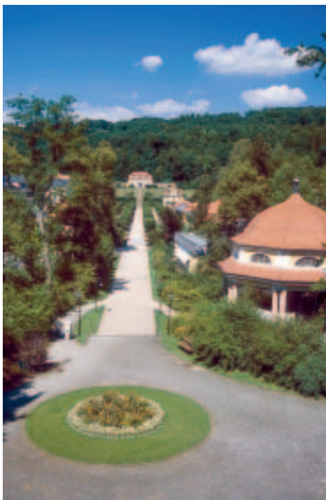
Kurpark von Bad Brückenau

• Information Staatliche Kurverwaltung , Elisabethenhof, 97769 Bad Brückenau, ☎ 09741/8020, ☎ 802440, www.bad-bruecke-nau.de oder Tourist-Information im Rathaus, Mo–Do 8.30–12 und 14–17 Uhr, Fr nur bis 16 Uhr, ☎ 80411, ☎ 6904. Hier ist eine Wanderkarte mit Touren durch die Umgebung erhältlich, www.badbrueckenau.com .