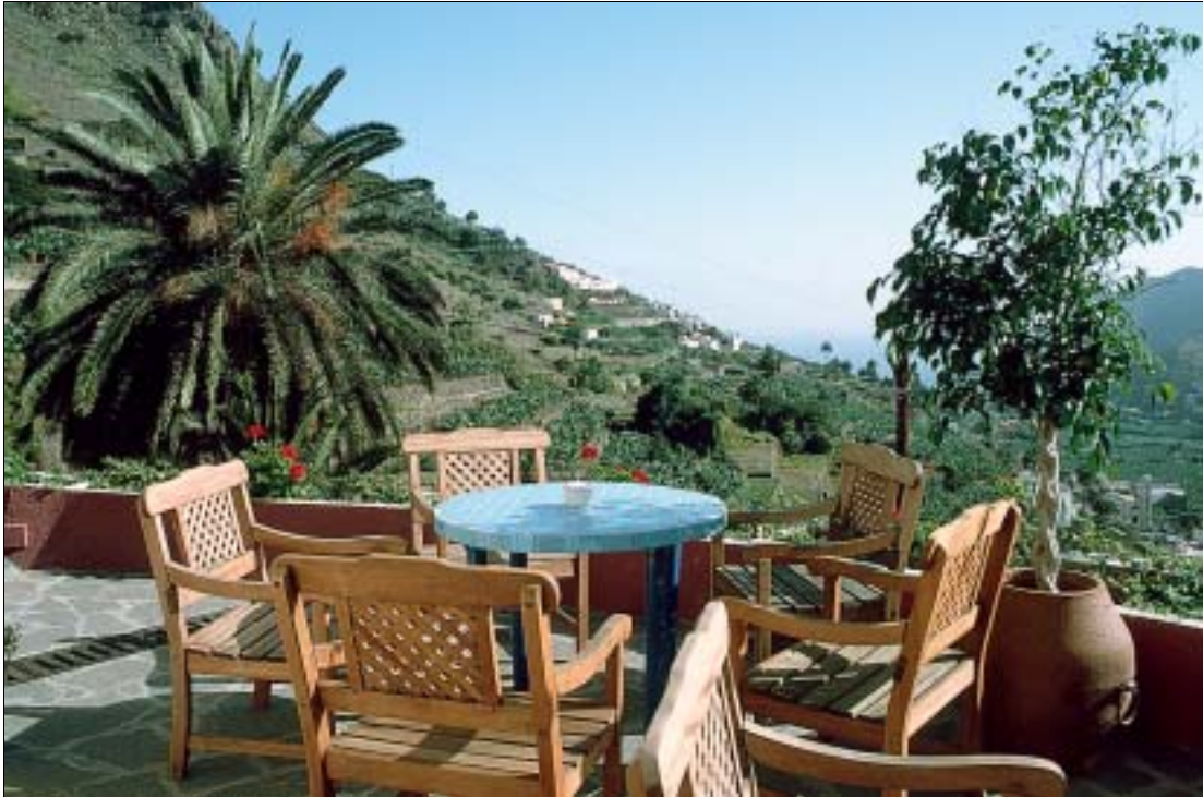
Die Terrasse des Landhotels Ibo Alfaro

schön gelegen im Tal von El Cedro. Buchbar über Ecorural. Für 2 Personen 47 €, bei 3 Personen 53 € und bei 4 Personen 59 €.