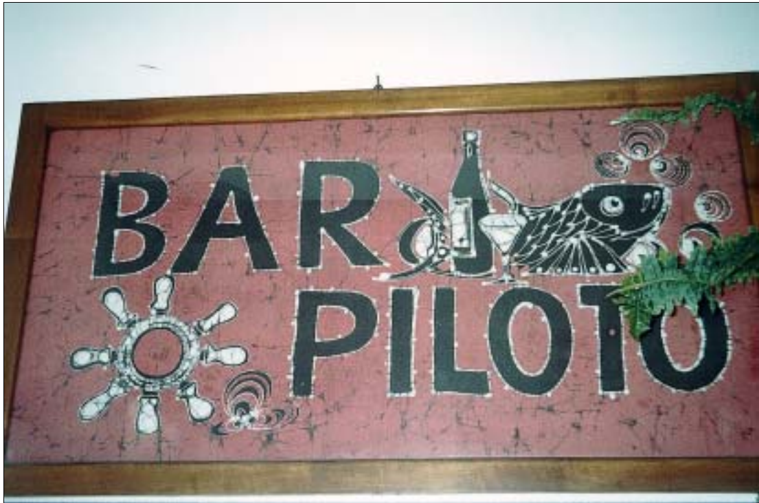
Bar Piloto: abends immer frische Fischgerichte

Bar Piloto (18) , ☎ 922-144063, 659-113341. Chefkoch Txus grillt hier frisch geangelten Fisch. Preise nach Gewicht. Dazu gibt es Salat und Papas Piloto, eine Eigenkreation mit Sesam und Palmhonig. Viele kommen auch an die kleinen Tische oder die Theke aus Kiefernholz, um einfach nur Bier, Wein oder Sangría zu trinken. Die Bar ist fast immer voll. Außer So täglich ab 19 bis ca. 24 Uhr. Zudem werden hier Apartments vermietet, Trommelworkshops und Exkursionen (20–60 €) angeboten. Vor Ort buchbar, auch als Pauschalpaket von Deutschland aus unter pilototour@terra.es.