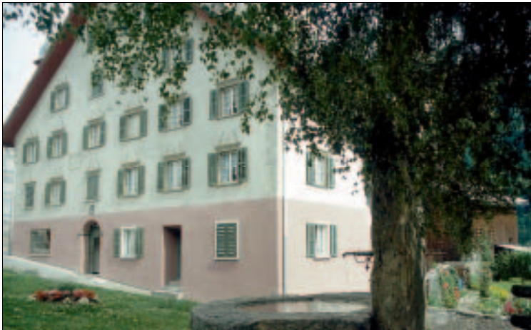
Geburtshaus von Alois Carigiet (1902–1985)

Künstlerische Spuren hat Alois Carigiet in seinem Heimatort an mehreren Stellen hinterlassen. Vor seinem Geburtshaus neben der Dorfkirche steht – schlicht und elegant – ein von ihm entworfener, aus zwei Granitblöcken gehauener Brunnen. Das Haus gegenüber, am Kirchplatz, zeigt Malereien in drei Reihen, oben die vier Tageszeiten, in der Mitte die vier Jahreszeiten, unten die vier Elemente. Die Katze (Nacht), die ihren Hintern der Kirche entgegenstreckt, soll Carigiets Antwort darauf gewesen sein, dass seine Entwürfe für die neuen Glasfenster bei der Renovierung der Kirche auf Ablehnung stießen. In der Totenkapelle der Kirche (meist geschlossen) findet man eine farbenprächtige Madonna des Malers und auf dem