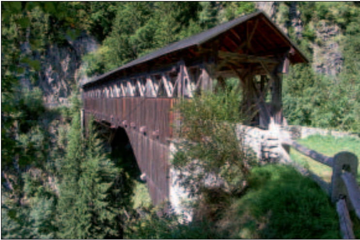
Holzbrücke über das Val Russein

Der freistehende, fragil wirkende Campanile ist ebenfalls aus Holz. Von weitem glaubt man erst an einen Leitungsmast, aber oben hängen zwei Glöcklein.