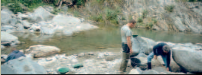
Körnchen nur, aber pur

Eine Genehmigung für die professionelle Ausbeutung der Goldvorkommen in einem Gebiet von 136 Quadratkilometer hatte die Gemeinde Medel/Lucmagn vor über 20 Jahren einer mittlerweile liquidierten Gesellschaft erteilt. Nach mehreren Transaktionen ist nun die kanadische NV Gold Corporation Inhaberin des vielleicht wertvollen Papiers. Ein eventueller Abbau des Goldes soll unterirdisch und umweltschonend erfolgen, ließ die Goldgräberfirma verlauten.