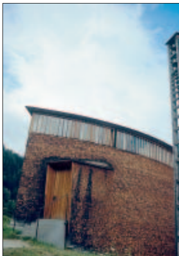
Kapelle Sogn Benedetg

Die Dorfkirche ist von außen imposant, das Innere vermag nicht zu überzeugen. Eine Sehenswürdigkeit besitzt Sumvitg dennoch, die Kapelle Sogn Benedetg im gleichnamigen Weiler knapp 2 km nördlich des Orts. Der bekannte Bündner Architekt Peter Zumthor, berühmt geworden durch seinen Vorschlag für das Gebäude der „Topographie des Terrors“ in Berlin (1993) und das Thermalbad in Vals (1996), hat hier 1988 einen höchst bemerkenswerten Bau errichtet. Der Grundriss ist tropfenförmig, die Außenwand komplett mit Lärchenschindeln gedeckt, darüber ein durchgehendes Glasfenster mit senkrechten Lamellen. Die senkrechte Linienführung setzt sich in den Stützbalken im Inneren und in der Tür fort. Zumthors Konzept erlaubt einen großen Lichteinfall, der durch das helle Holz im Inneren noch unterstützt wird. Hell sind das Parkett, die Bankreihen aus Lindenholz und ein schlichtes Altartischchen, das von Ikea stammen könnte. Für die stille Andacht ist die „Caplutta Nova“ (Neue Kapelle) bestimmt besser geeignet als mancher durch seine Bilderflut ablenkende Barockbau.