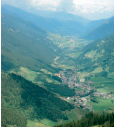
Vorderes Rheintal bei Disentis

Auch wer sich nicht für die Klostergeschichte interessiert, wird Disentis einen angenehmen Ferienort finden. Die Witwe des russischen Zaren Alexander II. urlaubte hier mit ihren zwei Töchtern, der letzte österreichische Kaiser mit seiner Gemahlin Zita, doch sind die Zeiten des mondänen Kurtourismus längst passé. Seit Stalins Außenminister Molotow wurden in Disentis keine VIPs mehr gesucht. Heute dominieren im Winter die Skifahrer, im Sommer die Wanderer und Töfffahrer, die vom Lukmanier- oder vom Oberalppass herunterwedeln.