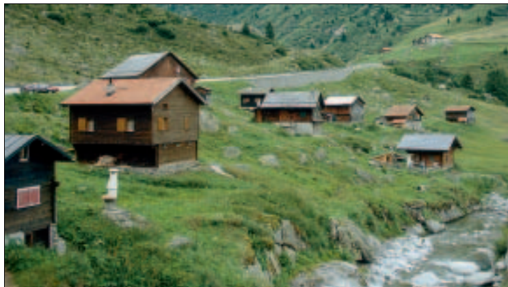
Am Medelser Rhein

Bekannt ist der Medelser Rhein vor allem wegen seiner Goldvorkommen. Jährlich, wenn der Schnee geschmolzen ist, geht bei der Einmündung des Medelser Rheins in