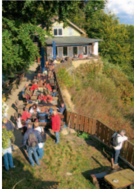
Waldgaststätte Rabenklippe – stets gut besucht

Luchsfütterung Mi/Sa 14.30 Uhr. Spenden willkommen. www.luchsprojekt-harz.de . Das Haus der Natur (s. o.) bietet Ausflugspakete („Luchsticket“) zur Luchsfütterung an (ca. 30 €).