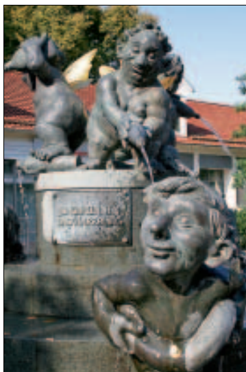
Witzige Wasserspiele in der Fußgängerzone

Bummelallee, Wandel- und Trinkhalle: Die kastaniengesäumte Herzog-Wilhelm-Straße, die Hauptachse der Stadt, erstreckt sich vom Bahnhof 2,5 km südwärts bis zum Berliner Platz, wo sie in den bescheidenen Kurpark mit der Burgbergseilbahn übergeht. Etwa auf halber Strecke, wo man seit 2006 den frechen Jungbrunnen von