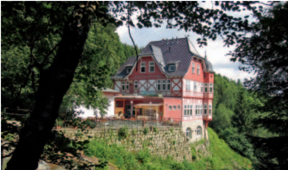
Die Steinerne Renne bei Wernigerode – eines der vielen Wanderziele im Harz