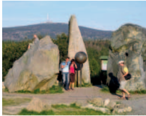
Gabbro, Granit und Diabas mit Brockenblick

• Essen Bavaria Alm , sieht aus wie sie heißt: Große alpine Skihütte mit entsprechen- dem Ambiente und tadelloser süddeutsch-