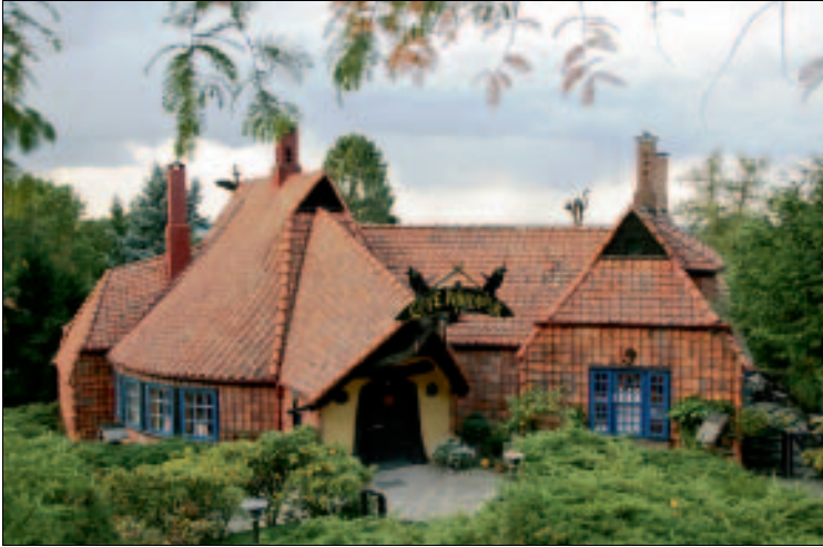
Café Winuwuk – der ungewöhnliche Name ist Programm

18 Uhr). Waldstr. 9, ☎ 05322-1459, www.winuwuk.de .