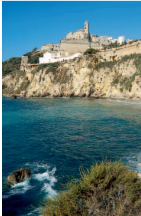
Befestigte Akropolis: Dalt Vila

Platja Talamanca: Die weit geschwungene Strandbucht erstreckt sich nur wenige Gehminuten hinter dem Siedlungsgebiet um die beiden Sporthäfen, ist deshalb von Eivissa nicht nur mit dem Bus, sondern auch ganz gut mit dem Bootsdienst von der Altstadt zur Marina Botafoch zu erreichen. Allerdings zeigt sich auch hier das Umfeld nicht gerade von der schönsten Seite, es wird immer noch viel gebaut. Mit einer Reihe von Hotels