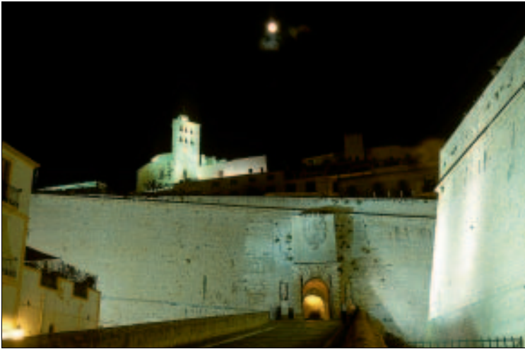
Eindrucksvoll: Mächtige Mauern bewachen die Oberstadt