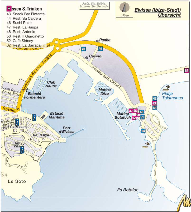
Eivissa (Ibiza-Stadt) Karten Umschlagklappe vorne und S. 90/91

Noch reizvoller, weil abgasfrei, sitzt man in den Freiluftcafés der nahen, baumbestandenen und verkehrsberuhigten Plaça des Parc , ein schöner Platz fürs Frühstück oder den Cocktail am frühen Abend.