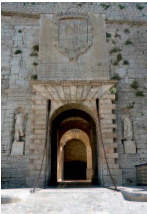
Hauptzugang zur Dalt Vila: Portal de ses Taules

Nach der Eroberung dauert es keine zwei Monate, bis auf den Grundmauern der maurischen Moschee die erste christliche Kirche wächst, Vorläuferin der Kathedrale. Von der Viertelung der Insel in die so genannten „Quartóns“ bleiben die Stadt und ihre Umgebung ausgenommen. 1299 wird Eivissa im Königreich Mallorca Sitz der Universitat , keine Lehranstalt, sondern de facto eine Gemeinderegierung der Pityusen. In den folgenden Jahrhunderten entwickeln sich außerhalb der Stadtmauern die Vorläufer der heutigen Viertel La Marina und Sa Penya. Mitte des 16. Jh. macht die ständige Bedrohung durch Piraten den Ausbau der Festung nötig, die Dalt Vila erhält ihre fantastischen Stadtmauern, Bollwerke und Tore der Renaissance. 1708 öffnet dank der Initiative der Dominikaner eine erste freie Schule, 1782 bekommt Eivissa das Stadtrecht und wird Bischofssitz. Allmählich steigt die Bevölkerungszahl, besonders deutlich im Viertel La Marina. Etwa ab der Mitte des 19. Jh. beginnt Eivissa, sich langsam über die traditionellen Grenzen hinweg auszudehnen. 1846 erscheint mit „El Ebusitano“ eine erste Zeitung. In den Jahren um die Wende des 19. zum