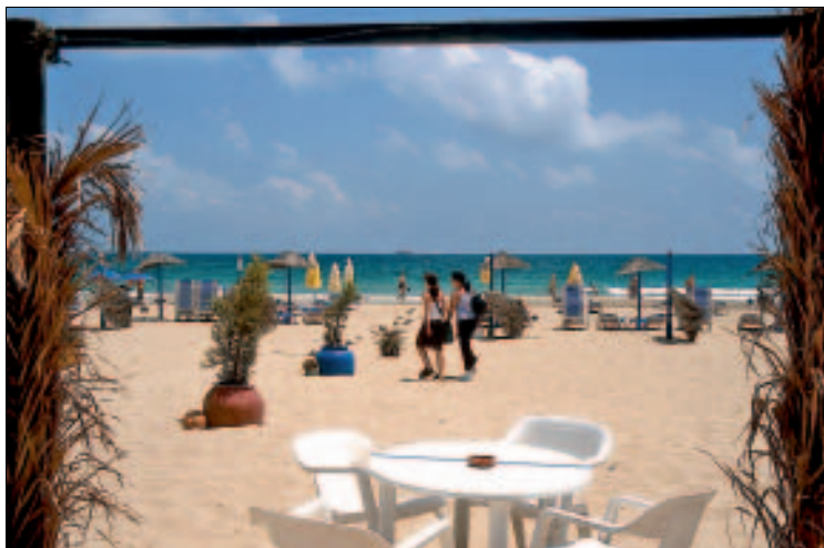
Breiter Strand aus feinem Sand: Platja d'en Bossa

der Rest von Figueretes, eine ganze Reihe von vorwiegend pauschal gebuchten Hotels. Im Umfeld finden sich Restaurants, die vor allem ihre günstigen Preise betonen und wohl mit Recht darauf vertrauen, durch Schilder à la „English Breakfast“ oder „Deutscher Kaffee und Kuchen“ Gäste anzulocken. Landeinwärts zeigt sich das Umfeld bodenständiger, hier ist die Infrastruktur mehr auf die Einheimischen zugeschnitten. Die schmalen, von felsigen Abschnitten unterbrochenen Strände von Figueretes sind miteinander durch eine gepflegte Fußgängerpromenade verbunden, insgesamt aber nicht allzu attraktiv. Schöner badet es sich an der Platja d'en Bossa, die noch in gestreckter Fußentfernung knapp zwei Kilometer weiter südlich liegt, jenseits des schmalen Siedlungsbereichs von Es Viver.