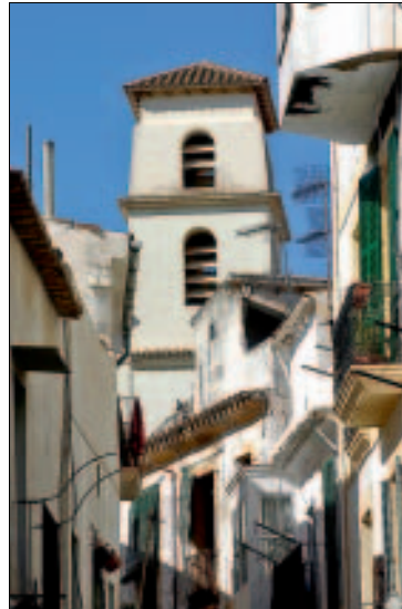
Enge Gassen, weiße Häuser: La Marina

Sa Penya und La Marina , die beiden alten Viertel der Unterstadt, sind der Dalt Vila zum Hafen hin vorgelagert. Einst dienten sie als Wohngebiete der Fischer, Handwerker und all jener, die kein Recht hatten, in der sicheren, befestigten Oberstadt zu leben. Heute bilden beide den Mittelpunkt des Nachtlebens der Hauptstadt, bersten vor allem im hafennahen Bereich geradezu vor Restaurants und Bars. Sa Penya , das östliche der beiden Viertel, besteht vorwiegend aus krummen Gassen und schlichten, weiß gekalkten Häusern. In seinem höher gelegenen, weniger be-