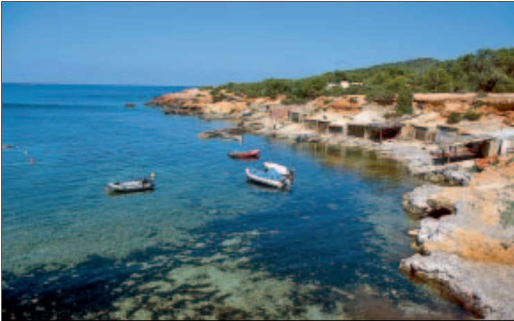
Abgelegen: Felsküste von Pou des Lleó

DZ/F zur NS rund 70 €, etwa vom 20. Juni bis 20. September ist aber mindestens Halbpension obligatorisch, für zwei Personen 90 €. Pou des Lleó, ☎ 971 335274, www.poudeslleo.com.