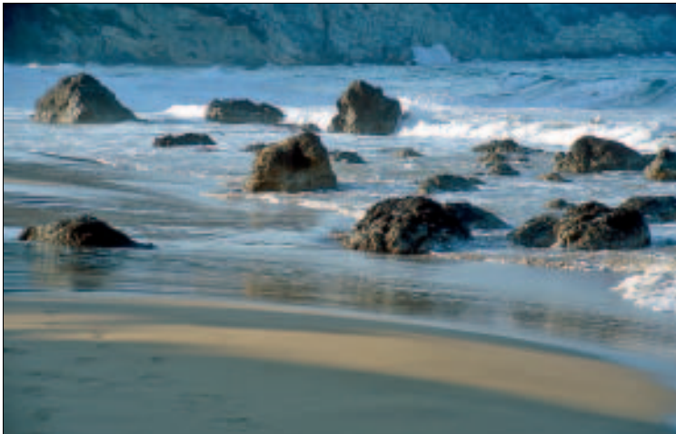
„Weiße Wasser“: Aigües Blanques

unterschiedlicher Größe, vom Studio bis zur Sechs-Personen-„Residenz“, alle mit eigener Kochmöglichkeit. Pool, Restaurant etc. Deutschsprachige Leitung. Geöffnet April bis Oktober. Zwei Personen zahlen im