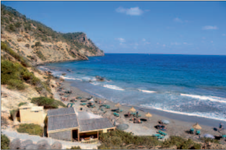
Dunkler Sand, ruhige Umgebung: Cala de Boix

• Übernachten * Hostal Cala Boix , neben der Zufahrt zum Parkplatz, dem Restaurant s'Arribada angeschlossen. Wieder eines der sympathischen, angenehm altmodischen Hostals, wie sie in diesem Gebiet – anders als im Rest der Insel – noch relativ