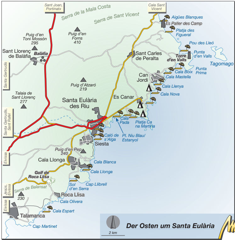
Der Osten um Santa Eulària