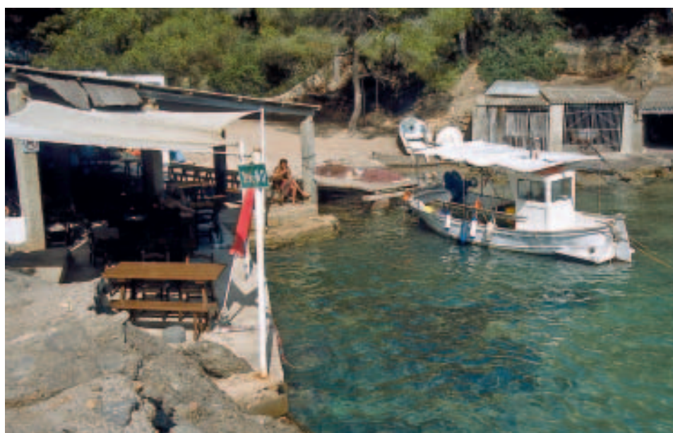
Urig: Restaurant „Bigote“ in der Cala Mastella