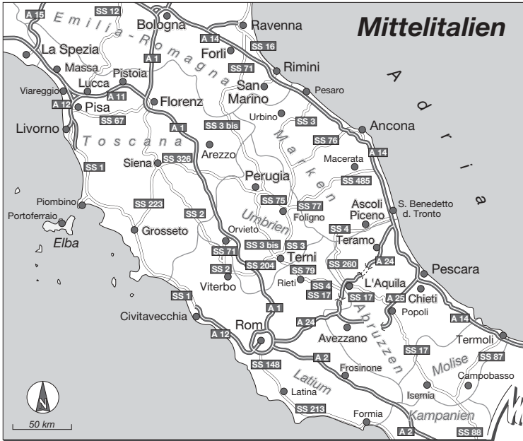
Marken Karte S. 375

eine Handvoll hübscher Seen, die sich für ein paar Tage Badeurlaub fern von der Küste anbieten. Der Lago di Bolsena ist der größte und vielleicht auch reizvollste – der Tourismus hält sich hier noch in erträglichen Grenzen. Über Rom schließlich muss man nicht viele Worte verlieren – außer, dass die Weltstadt noch erstaunlich viele ruhige und ursprüngliche Ecken hat, wo auch Großstadtmuffel auf ihre Kosten kommen.