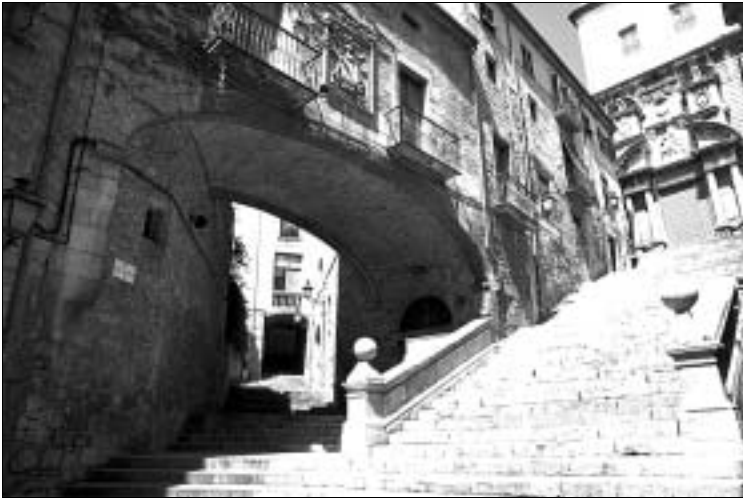
Drunter und Drüber: Treppengassen in der Altstadt