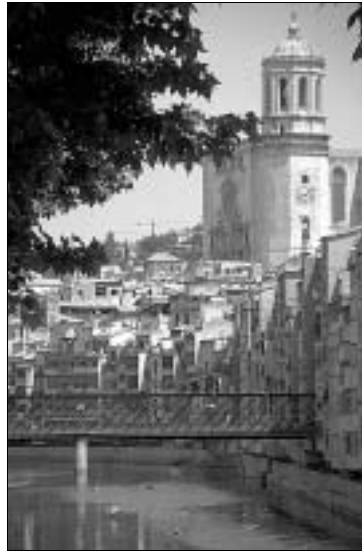
Romantisch: Blick auf Fluss und Altstadt

Öffnungszeiten Mai bis September Di-So 10–20 Uhr, restliche Monate Di-Fr 10–18 Uhr, Sa 10–20 Uhr, So 11–15 Uhr; Eintrittsgebühr 3 €. www.museudelcinema.org .