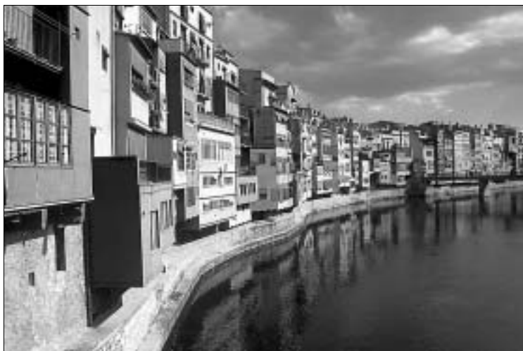
Malerische Zeile am Fluss: Häuser über dem Riu Onyar