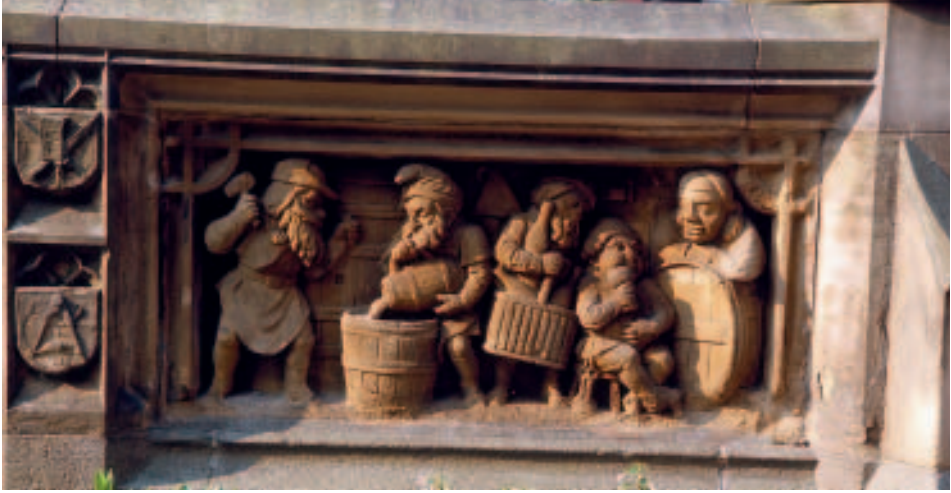
Heinzelmännchenbrunnen vor dem Brauhaus Früh am Dom