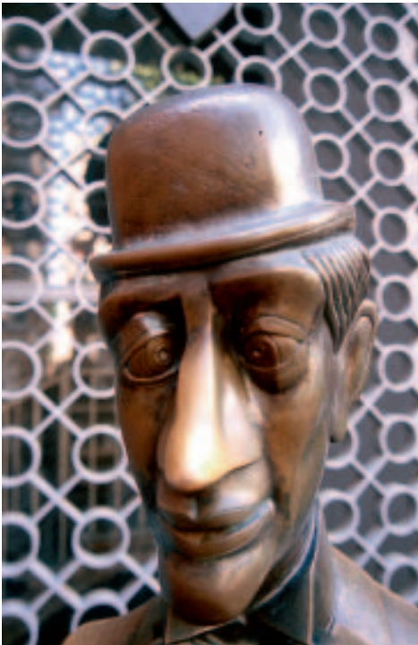
Zwei Kölner Originale: Schäl ...

Anschließend führt die Lintgasse links zum → Fischmarkt . Wer mag, kann einen längeren Blick auf das prachtvolle Haus Lintgasse 5 aus dem Jahr 1643 werfen. Es handelt sich um eines der sehr seltenen Gebäude aus dieser Zeit, die den Weltkrieg unversehrt überstanden haben. Der Gassenname verweist auf die Korbflechter (Lintschleißer), die aus Lindenbast u. a. das Seilmaterial herstellten, das die Fischer auf dem nahen Markt natürlich gut gebrauchen konnten.