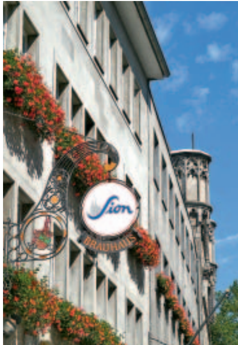
Die Brauhäuser in der Altstadt sind Sehenswürdigkeiten