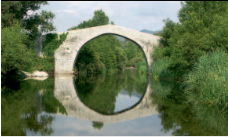
Spin' A Cavallu, der „Pferderücken“ – Brücke über den Rizzanese

Nachdem die Bäume abgeholzt wurden, hat jetzt die Kamera freien Blick, doch hat die Örtlichkeit dadurch und mit den steinernen Picknickbänkchen etwas von ihrer früheren Romantik eingebüßt.