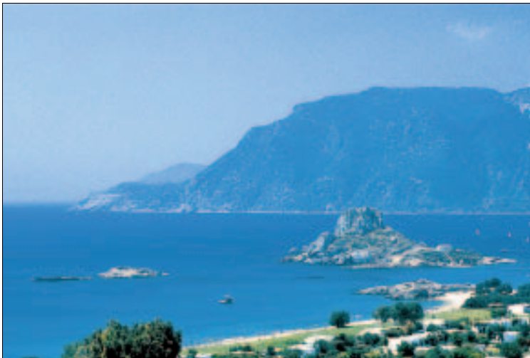
Bucht von Kefalos: beste Aussicht für Strandfaulenzler

Insel Kastrì: Kaum ein Reiseführer oder Prospekt verzichtet auf den Abdruck eines Fotos der Bucht von Kefalos. Aus gutem Grund, denn es handelt sich um eines der reizvollsten Motive auf der Insel. Ein Aussichtspunkt neben dem Highway, etwa 500 m östlich des Club Med, bietet eine sehr gute Fotoperspektive, die sich auch die meisten Katalogmacher zunutze machen. Blickfang ist die Insel Kastrì, etwa 90 m vom Ufer entfernt. Selbst schlechte Schwimmer können das Eiland erreichen. Auf dem Inselchen befindet sich die Kapelle des hl. Nikolaus, dem Schutzpatron der Seefahrer, die allerdings in der Regel verschlossen ist.