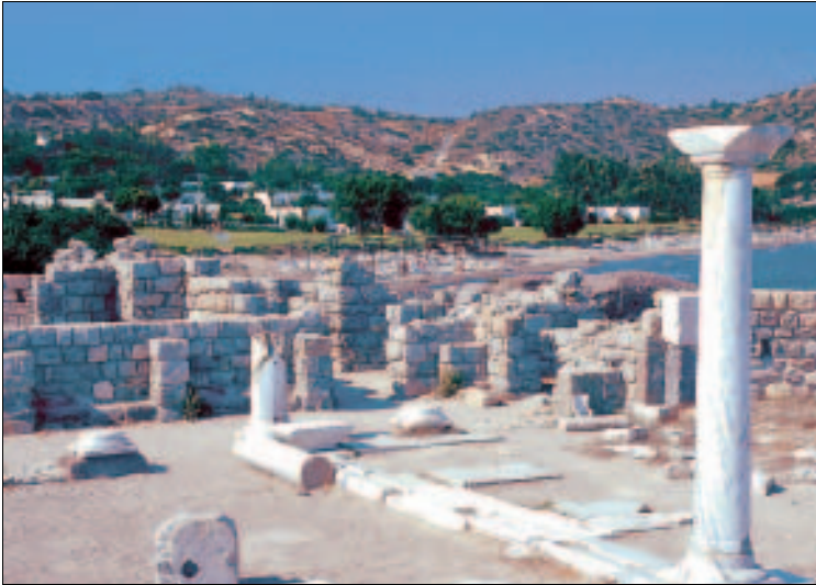
Überreste der Basilika Ag. Stefanos

Ag. Stefanos: Am Strand vor dem Gelände des inzwischen geschlossenen Club Med, gegenüber der Insel Kastri, sind die Überreste der frühchristlichen Basilika Ag. Stefanos zu besichtigen. Errichtet wurde das antike Heiligtum zwischen 496 und 554 n. Chr., zu einer Zeit, als die Insel Kastri mit dem Festland noch durch eine Brücke verbunden war, die später bei einem Erdbeben einstürzte. Der italienische Archäologe Luciano Lorenzi legte die Basilika 1932 frei und richtete vier Säulen wieder auf. Eigentlich handelt es sich um eine Doppelbasilika: zwei dreischiffige Kirchen mit einer gemeinsamen Taufkapelle am Kopfende. Die Mosaik der Basilika sind größtenteils mit Kies bedeckt, um sie zu schützen.