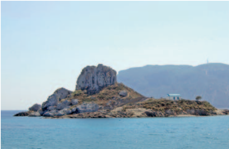
Kleine Insel, große Bucht: der Westen von Kos