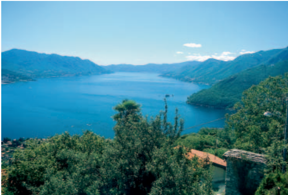
Oberhalb von Maccagno: Panoramablick auf den gesamten See