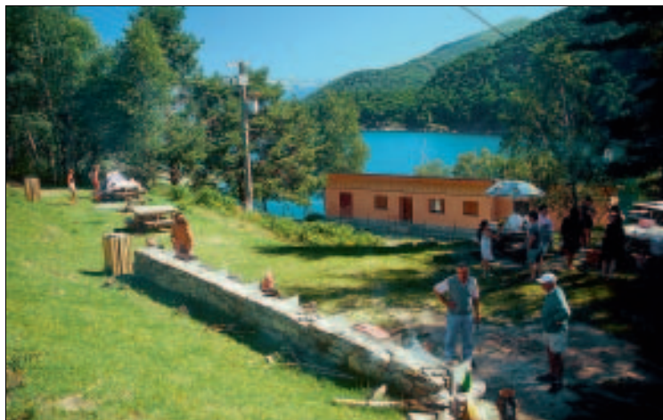
Picknickplatz am Lago d'Elio

Die Legende berichtet von einem Dorf am Grund des Lago d'Elio, das einst einem Fremden die Gastfreundschaft verweigerte und zur Strafe von den Fluten verschlungen wurde. In dunklen, stürmischen Nächten soll man die Glocken des versunkenen Campanile hören, die die umliegenden Dörfer zu Hilfe rufen.