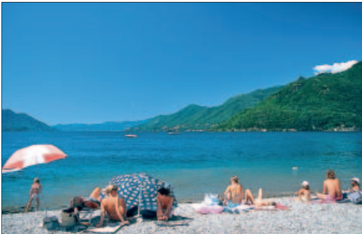
Bei Familien beliebt: Badezone in Maccagno

Schiff , Anlegestelle beim alten Hafen von Maccagno Inferiore. Mehrmals tägl. Verbindungen nach Luino, Cannobio, Cannero Riviera u. a.