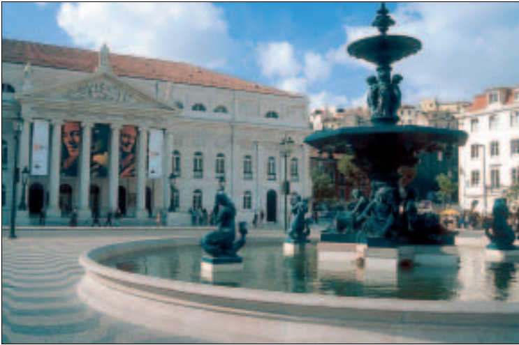
„Wohnzimmer“ der Lissabonner: der Rossio

die sich im Stammsitz des Banco Comercial Português – Millennium BCP an der Ecke Rua Augusta und Rua da Conceição befindet.