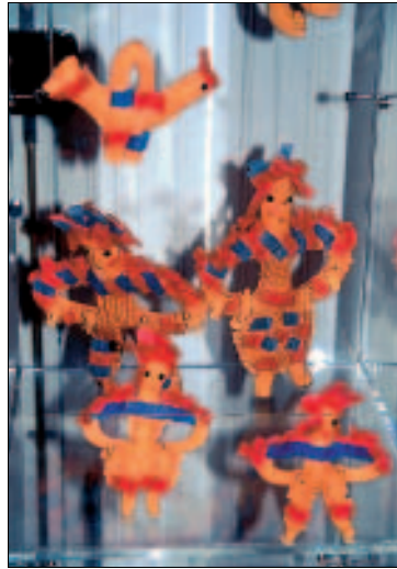
Spielzeugausstellung im Ethnografischen Museum

An dem bisher kaum besiedelten Küstenabschnitt zwischen Ribeira Brava und Ponta do Sol entsteht eine neue Anlage für Urlauber, die den Tourismus in diesem Gebiet ankurbeln soll. An einer Marina wurde 2009 noch gebaut, Hotels und Appartementanlagen sollen folgen. Die Touristinformation und eine Zweigstelle des Umweltamts sind in einen bereits fertiggestellten Pavillon gezogen. Sie finden ihn auf der Uferseite. Das Umweltamt hat hier mit Hilfe von Molen die Lagune, ein Biotop an der Küste, gesichert. Die Süß- und Salzwassermischung schafft hier die Grundlage für eine besondere Vegetation und damit Ruhezeiten für Zugvögel. Im Pavillon kann man sich über das Leben in der Lagune informieren.