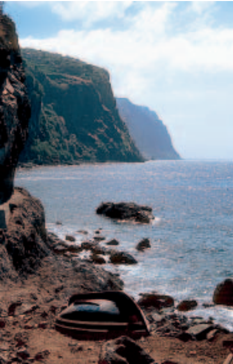
Die Klippen im Südosten erreichen mehr als 500 m Höhe

Lokalpatrioten behaupten, dies sei das zweit- oder dritthöchste Kliff der Welt. Mit 578 m Höhe ragt das Cabo Girão eindrucksvoll und steil aus dem Meer.