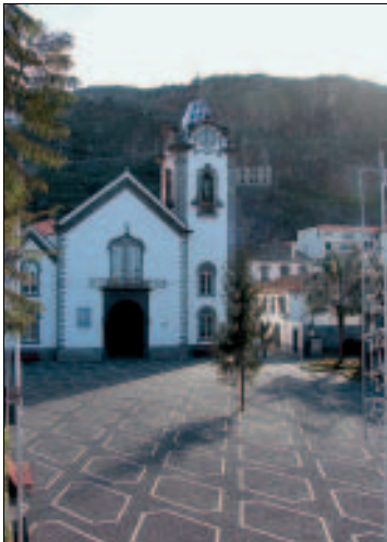
Grafische Muster schmücken den Kirchplatz von São Bento

Museu Etnográfico da Madeira: In den Mauern des ehemaligen Klosters Santa Clara, versehen mit einem modernen Vorbau, liegt Madeiras Volkskundemuseum, das mit Liebe zum Detail und unter ästhetischen wie pädagogischen Gesichtspunkten gestaltet wurde. Alle Lebens- und Arbeitsbereiche der ländlichen Bevölkerung Madeiras in den vergangenen Jahrhunderten sind hier mit Originalexponaten nachgebaut. Den traditionellen Fischfang demonstrieren die typischen bunten Holzboote, eine alte Zuckerrohrpresse steht in der Abteilung, die an den Zuckerrohranbau erinnert. Mit nachgebautem Dreschplatz und einer Mühle nimmt der frühere