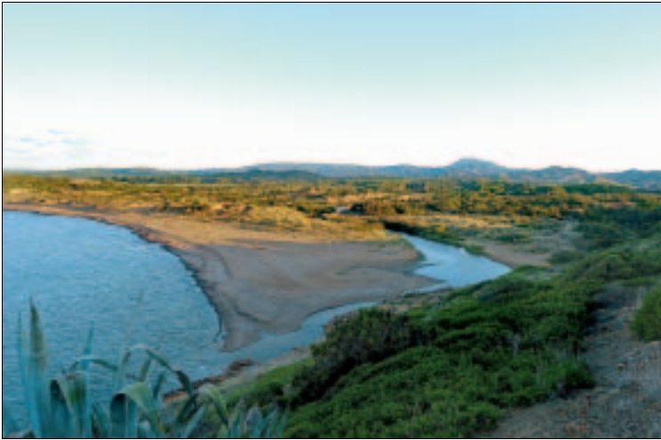
Cala Tirant: Bei Nordwind türmen sich hier die Wellen

Die Bucht reicht etwa vier Kilometer weit ins Inselinnere und erreicht an manchen Stellen eine Breite von knapp zwei Kilometern. Sie ist auch erdgeschichtlich interessant, bilden die kargen Hügel, die westlich direkt hinter den letzten Häusern von Fornells beginnen, die ältesten Gesteinsformationen der gesamten Balearen; sie stammen aus dem Devon, sind also rund 400 Millionen Jahre alt (→ Kapitel „Steine, Schluchten und sanfte Hügel“).