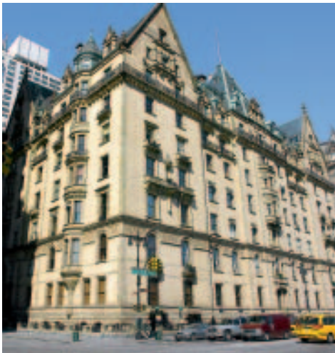
Das Dakota: Hier starb John Lennon

Noch berühmter ist das schlossartige Dakota an der 72nd Street. Hier wurde am 8. Dezember 1980 John Lennon erschossen. Seine Witwe Yoko Ono wohnt noch immer im selben 20-Zimmer-Apartment. Das etwas düstere Gebäude diente auch Roman Polanski als Drehort, hier wurde Rosemaries Baby geboren. Das Haus war das erste Luxusapartmenthaus an der Westseite des Central Park, erbaut von dem Architekten Henry Hardenbergh 1884, als die Gegend noch von Armut geprägt war,