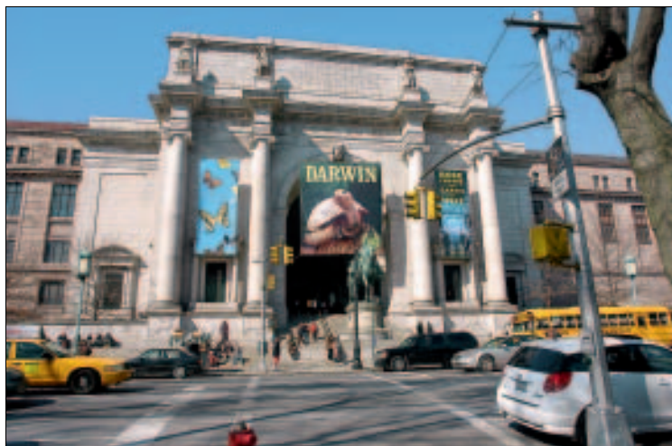
Hier geht's zu den Dinosauriern: das Natural History Museum

Im Erdgeschoss finden sich Abteilungen zur Naturgeschichte des amerikanischen Kontinents, die Hall of Ocean