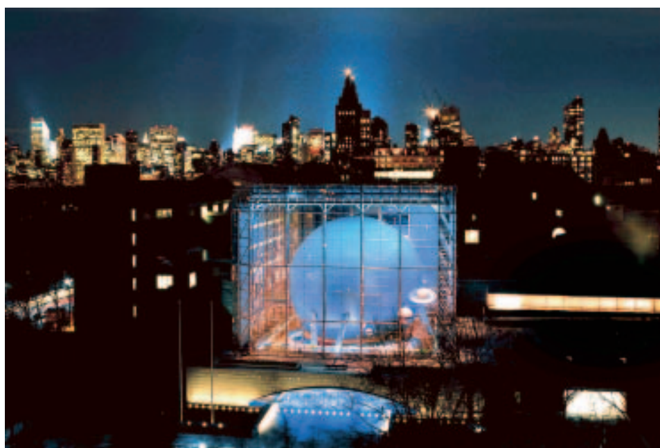
Ultramodern: Rose Center for Earth and Space