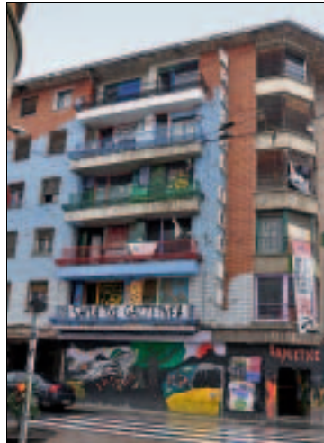
Politik ist im Baskenland überall präsent

Der Plan Ibarretxe: Der nächste Zug im Schach zwischen Basken und spanischer Regierung kam dann wieder von der gemäßigten PNV und nannte sich Plan Ibarretxe. Im Herbst 2002 veröffentlichte der Lehendakari (Präsident des baskischen Regionalparlaments) Juan José Ibarretxe ein Papier, in dem für Ende 2005 der Status des Baskenlandes als „estado libre asociado“ angestrebt wurde – de facto also eine Unabhängigkeitserklärung. Madrid und die EU wiesen die Ziele der Erklärung umgehend zurück, die baskische Regierungskoalition distanzierte sich jedoch in keiner Weise vom Plan Ibarretxe. In Teilen des Volks selbst wuchs allerdings der Unmut gegen den „obligatorischen Nationalismus“: Bei einer Demonstration in Donostia-San Sebastián gingen im Herbst 2002 mehr als 100.000 Protestierende mit dem Ruf „¡Basta Ya!“ auf die Straße.