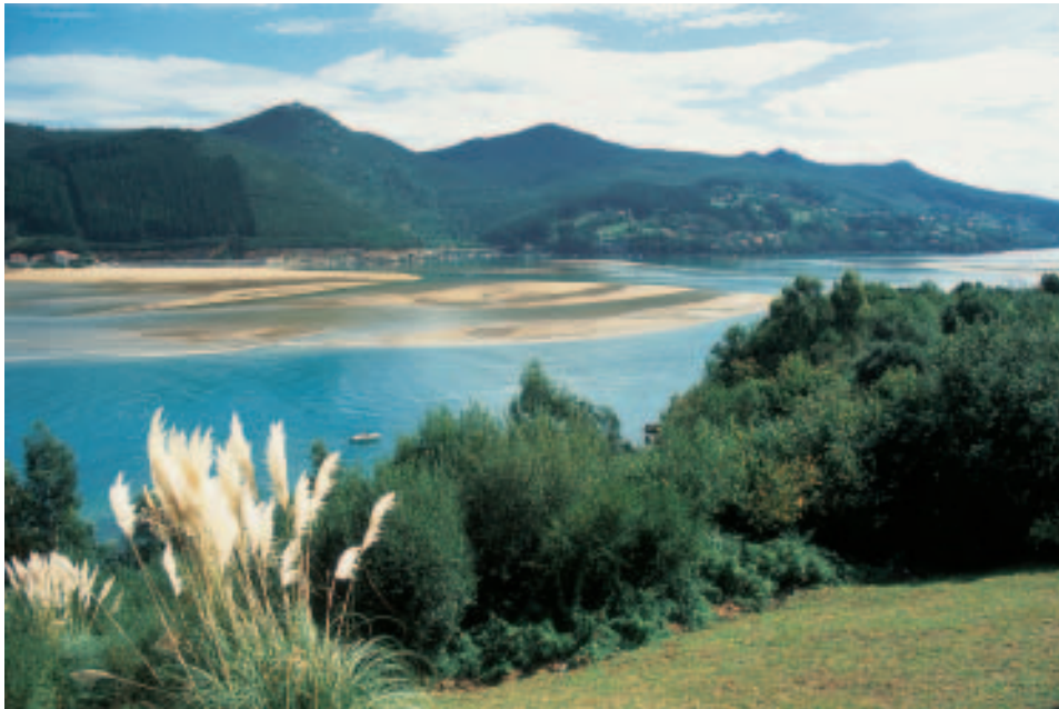
Morgenlicht: Blick auf die Reserva Urdaibai