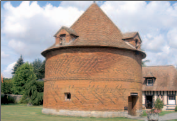
Das Taubenhaus im Garten des Château de Vascoeuil