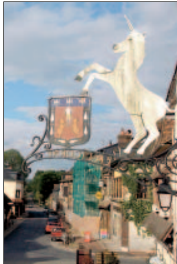
Ein Einhorn in Lyons-la-Forêt