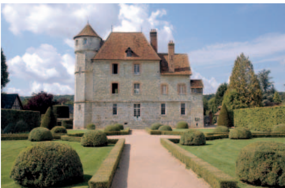
Château de Vascoeuil