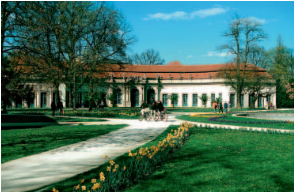
Schlossgarten mit Orangerie