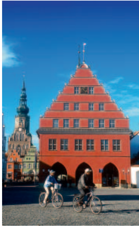
Das rote Rathaus und die Nikolaikirche

Das Innere der Kirche wurde im 19. Jh. dem Zeitgeist der Romantik folgend im neogotischen Stil umgebaut. Heute zeigt sich die weiße Verblendung des Backsteins teils etwas ergraut und bröckelnd. Von der mittelalterlichen Innenausstattung ist