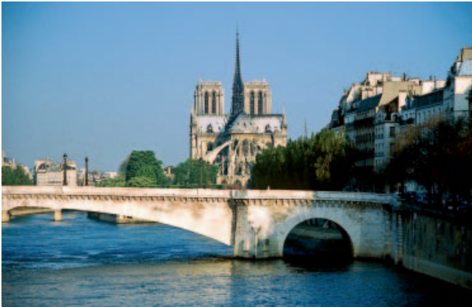
Notre-Dame – die französische Mutterkirche