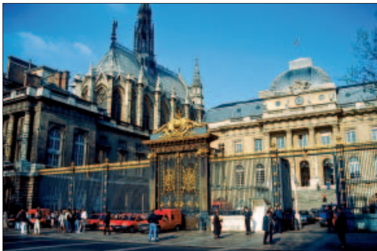
Justizpalast und Sainte-Chapelle