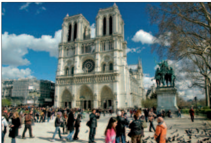
Notre-Dame – vollendete Gotik

der Familie Rothschild und kann nicht von Innen besichtigt werden. Eindrucksvoll ist auch das 1657 errichtete Hôtel de Lauzun am Quai d'Anjou (Nr. 17), das durch den von Charles Baudelaire und Théophile Gautier im 19. Jahrhundert gegründeten Club der Haschischraucher berühmt wurde. Gegenwärtig werden in dem reich dekorierten Stadtpalais wichtige Gäste der französischen Regierung beherbergt. Einen Besuch lohnt die inmitten der Insel gelegene barocke Kirche Saint-Louis-en-l'Île .