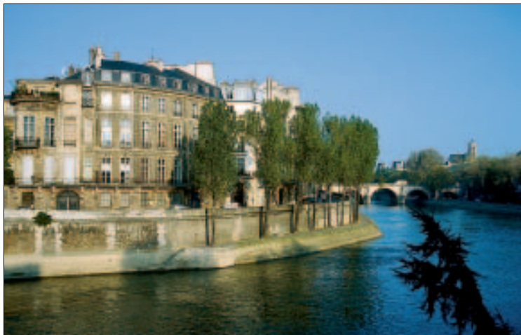
Wie ein steinernes Schiff – Ile Saint-Louis

Tgl. 8–18.45 Uhr, So bis 19.45 Uhr; Turm: 10–18.30 Uhr im Sommer und 10–17.30 Uhr im Winter, Juni–Aug. Sa und So bis 23 Uhr. Jeden Sonntag um 16.30 Uhr kostenlose Orgelkonzerte. Eintritt Turm 8 €, erm. 6 €. Für EU-Bürger unter 26 Jahren ist der Eintritt frei! www.notredamedeparis.fr .