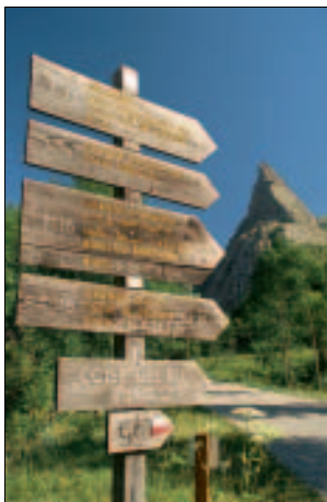
Aufstieg zum Colle Greguri ...

Hier in der Senke zwischen Rocca Castello und Monte Eighier (2.574 m) hat man eine prachttvolle Aussicht in den Talschluss des Vallone del Maurin, wo langgezogene,