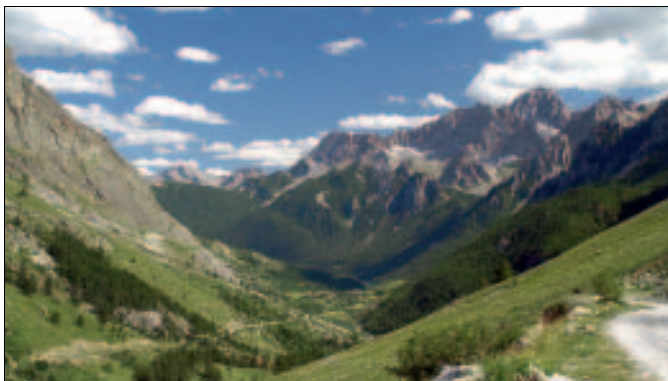
Vallone del Maurin, mit Blick nach Südosten und auf den Monte Oronaye

► Sobald der Weg in eine Schotterstraße 9 mündet, folgt man dieser auf eine Häusergruppe zu, die Grange Collet . Hier verlässt man die Straße gleich wieder und geht links an den Häusern vorbei. Der dahinterliegende Hügel mit Holzkreuz wird östlich umrundet, während die Schotterstraße einen weiten Schlenker nach Westen einlegt. Etwa 10 Min. später und ca. 100 m tiefer treffen beide 10 nahe der Grange Ciarviera wieder zusammen.