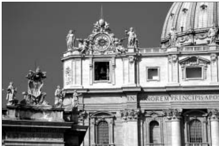
St. Peter: Fassade von Carlo Maderno

und war eine leichte Beute. Papst Leo IV. zog deshalb eine große Schutzmauer um den Vatikanischen Hügel. Die Plünderung durch die Normannen im Jahr 1084 konnte aber auch sie nicht verhindern.