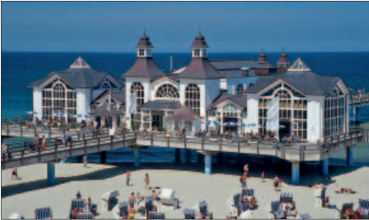
Sellins Seebrücke heute ...