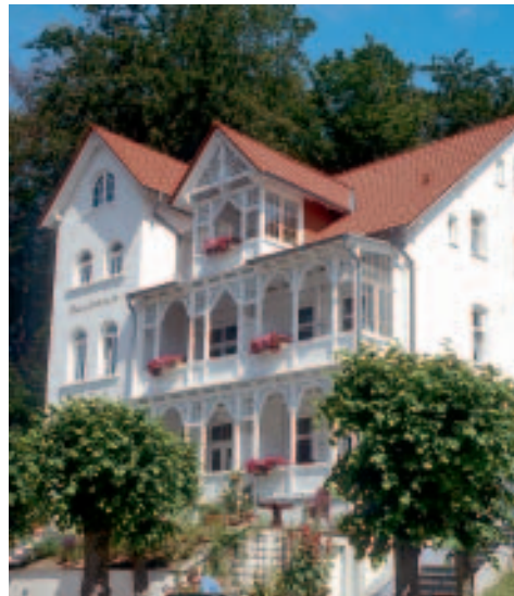
Bäderarchitektur in der Wilhelmstraße