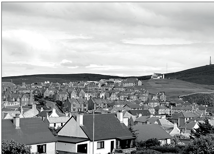
Lerwick: seit über 2700 Jahren besiedelt