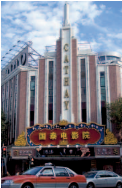
Art déco vom Feinsten – Cathay Theatre

☎ 54042095. 📍 1 Shanxi Rd., 870 Huaihai Rd., 中国上海市淮海中路870号