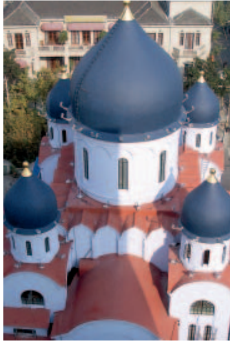
Die russische-orthodoxe Kirche wurde 1931 errichtet

Während der Kulturrevolution beraubten die Kommunisten auch diesen