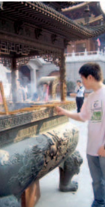
Die Ursprünge des Jing'an Klosters gehen auf das Jahr 247 zurück

Wo heute eine städtische Einrichtung für Kinder untergebracht ist, residierte einst Sir Elly Kadoorie (1867–1944). Er war nicht nur ein grandioser Kaufmann, sondern auch ein begeisterter Tänzer. Folglich ließ sich der damalige Präsident der „Shanghai Zio-