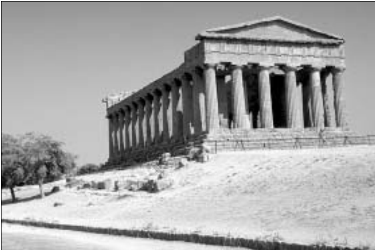
Bestens erhalten: der Concordiatempel

Die Tagesvisite legt man am besten in die frühen Morgenstunden, wenn es noch angenehm kühl und relativ leer ist; später rollen zum einen die Reisebusse an, vor allem aber kann die Hitze wirklich mörderisch werden. Schade, dass die Erläuterungen fast durchgängig nur auf Italienisch gehalten sind. Die Benennung der Tempel ist übrigens in der Regel willkürlich – Anzeichen, welcher Gott in welchem Tempel verehrt wurde, sind noch nicht aufgetaucht. Von manchen Tempeln (Herkules-, Concordiatempel) weiß man immerhin, dass sie in römischer Zeit ihren Namenspatronen geweiht waren; aus griechischer