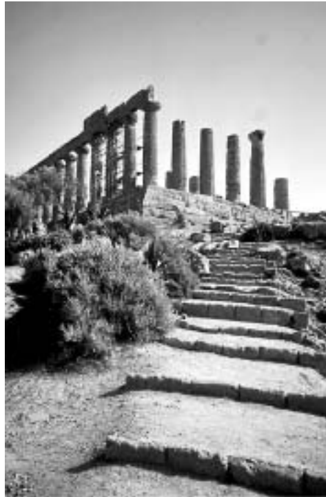
25 Säulen stehen noch: Tempio di Giunone

Obwohl die Stadt nur etwa 60.000 Einwohner hat, wirkt sie durch ihre räumliche Ausdehnung viel größer. Bus- und Bahnreisende treffen am Rand der Altstadt ein, die im oberen Teil eines 350 Meter hohen Hügels liegt. Von hier sind es nur ein paar Schritte zur Via Atenea , der verkehrsberuhigten Haupt- und Promenierstraße von Agrigento. Etwas südlich des Zentrums stehen die Hochhäuser der Neustadt. Zwar schon ein Stück tiefer, versperren sie aber trotzdem an vielen Stellen den Blick, wirken wie eine städteplanerische Schandtat erster Ordnung – wobei von Stadtplanung im eigentlichen Sinn aber keine Rede sein kann, ist Agrigento doch weithin durch die selbst für sizilianische Verhältnisse