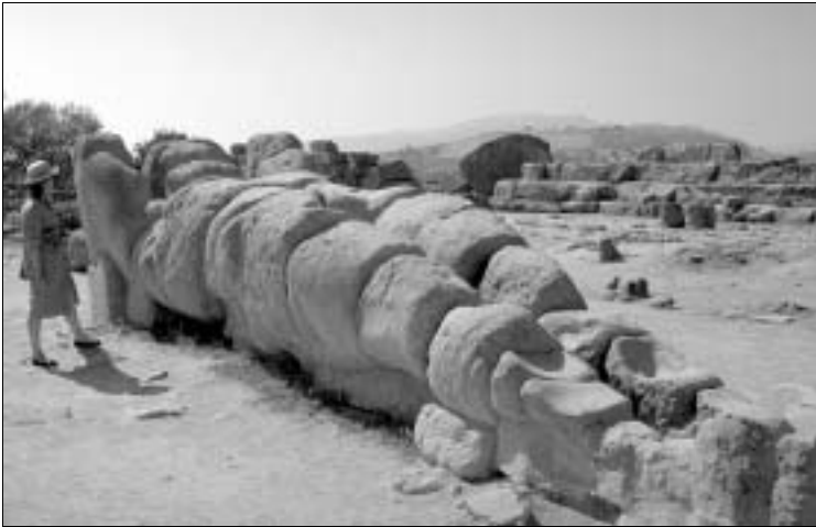
Kopie eines Telamons: Das Original wurde früher als Grillplatz missbraucht

Quartiere Ellenistico-Romano: Die Reste eines griechisch-römischen Wohnviertels liegen schräg gegenüber des Museums; Zugang mit dessen Eintrittskarte. Zu sehen sind noch die Grundrisse der Häuser und Teile der Kanalisation.