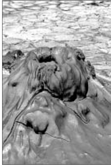
Harmlos: ein „Vulcanello“

bauten Tempel blieben 25 Säulen erhalten. Die Brandspuren, die an manchen Stellen im Inneren zu sehen sind, stammen von den Karthagern, die den Tempel 406 v. Chr. nach kampfloser Einnahme der Stadt in Brand setzten; die Römer restaurierten ihn dann wieder. Unterhalb des Tempels erkennt man Reste der Stadtmauer und byzantinische Grabhöhlen. – Der Tempio di Esculapio , ein ganzes Stück südlich an der Straße nach Porto Empedocle, ist nur etwas für ganz gewissenhafte Besucher: Viel ist von ihm nicht erhalten geblieben.