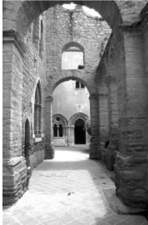
In Agrigentos Altstadt: das Monastero di Santo Spirito