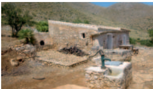
Rifugio del Falco, ein ehemaliges Bauernhaus in der Località Sughero

Unterhalb der Grotta dell'Uzzo setzen wir die Wanderung auf dem küstenparallelen Hauptweg fort, den wir bis zum Ende der Tour am südlichen Parkeingang 1 nicht mehr verlassen. Bergseitig stößt der Weg 16 von Sughero 10 dazu. Es folgt ein aufregend schöner Abschnitt, immer wieder führen kurze