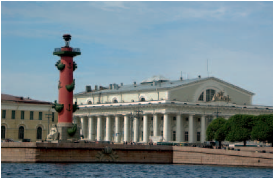
Rostra-Säule und Börse (auf der Strelka)