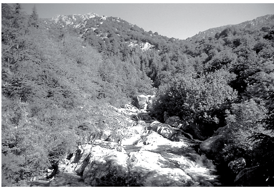
Wildromantisches Rinnsal: einsamer Gebirgsbach in den Cevennen