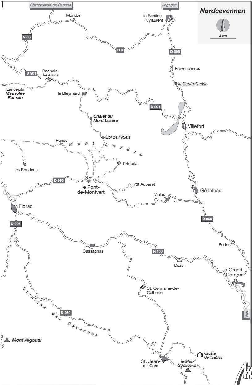
Cevennen Karte S. 556/557