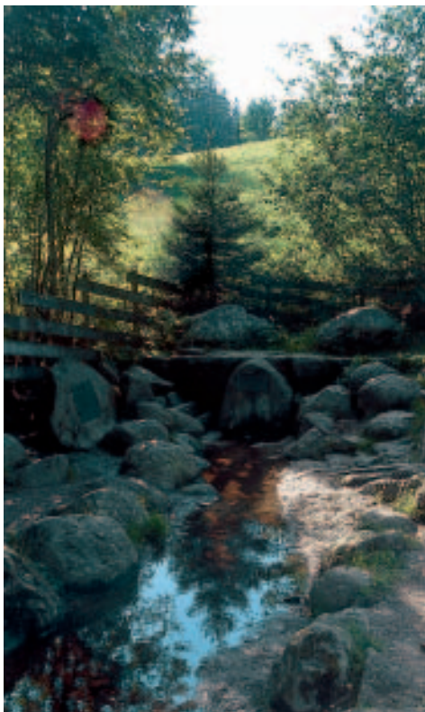
Hier entspringt die Breg