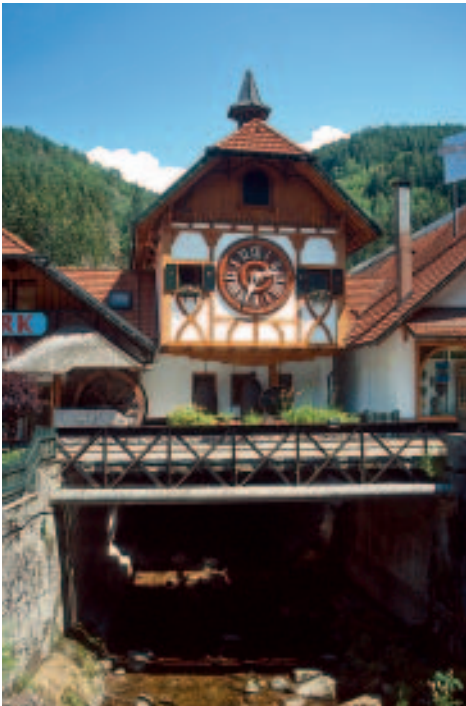
Die weltgrößte Kuckucksuhr im Eble Uhren-Park

So weit, so gut. Doch unter der Oberfläche kriselt es. Die florierenden Entwicklungsachsen am Oberrhein und entlang der Autobahn Stuttgart – Singen stellen den Raum Triberg ins Abseits. Die Zeiten, da Triberg den weltweit ersten elektrisch angetriebenen Skilift eröffnete (1909) oder auf dem Bergsee die Europameisterschaften im Eiskunslauf stattfanden (1925), sind lange vorbei. Betriebe machen dicht, Läden stehen leer. Dass ein Ort binnen zwei Generationen ein Drittel seiner Einwohner verliert – und der Trend geht weiter abwärts –, ist in Baden-Württemberg trauriger Rekord. Eine Wende sollte die Erlebniswelt Triberg bringen, ein Großprojekt, bei dem die Gäste mit einer Miniaturausgabe der Schwarzwaldbahn um den Wasserfall fahren und die Hauptstraße unter ein Plexiglasdach kommen sollte. Nach dem Ausstieg der beiden Privatinvestoren fehlt der Gemeinde nun das Geld, um das Vorhaben zu verwirklichen.