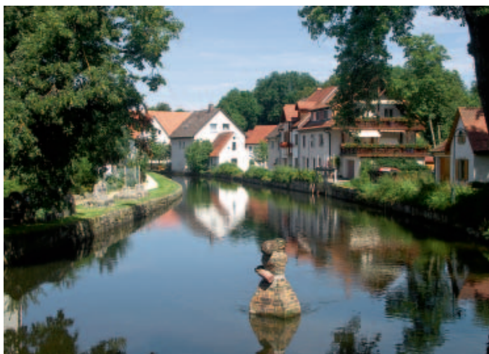
Keramikkunst in der Breg, Hüfingen