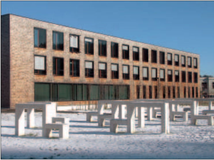
Eckig, praktisch, gut? Neubau der Hochschule Furtwangen