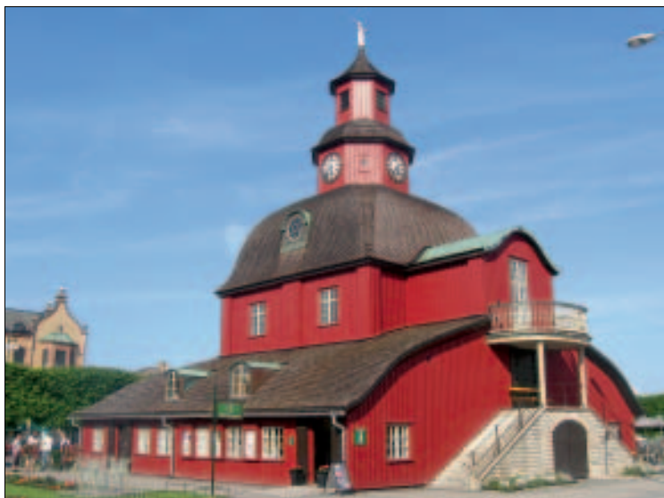
Im gräflichen Jagdschloss residiert nun das Touristbüro von Lidköping

Richtung Vänernufer erstreckt sich der Industriehafen mit dem eigentlichen Besucher magneten der Stadt, dem Rörstrand-Center . Vom Nya torget ist das vielbe-