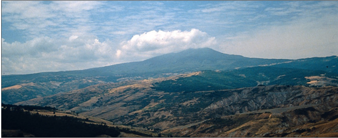
Blick auf den Monte Amiata

kleinen Holzleiter (4) geht es links hoch. Der Anstieg verläuft über die Westseite des Monte Labbro und lässt einen durch die charakteristische Wiesenlandschaft mit Kalksteinen wandern. Der Eisenzaun, an dem man vorbeikommt, dient als Einzäunung einer Grotte (5), in der Fledermäuse wohnen (nicht zu besichtigen!). Weiter geht es rechts an der Grotte vorbei in Richtung Gipfel. Dem Weg weiterfolgend, sieht man aus einiger Entfernung bald das Gipfelkreuz des Monte Labbro. An einer Weggabelung folgt man dem Weg über eine zweite kleine Holzleiter (6) und läuft geradeaus in Richtung Gipfel hoch. Oben am Gipfelkreuz (7) angekommen, können die kegelförmige Steinfestung mit Gipfelkreuz und Symbol von David Lazzaretti, die Überreste einer Kirche und eine Höhle besichtigt werden.