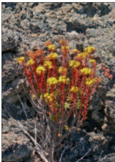
Das Spatelige Aeonium siedelt an grober Lava

eine Wasserstelle des Kanals Vergara. Hier verlassen wir nun endgültig den Wasserkanal und wandern über den absteigenden Schotterweg nach rechts. Der steinige Weg zieht sich jetzt nicht mehr durch Wald, sondern durch die mit silbern schimmernden Flechten bewachsenen Ausläufer des Vulkans Chinyero hindurch. Spatelige Aeonien ( Aeonium spathulatum ) bilden von April bis Juli mit ihren goldgelben Blüten regelrechte Farbkleckse in dieser bizarren Lavalandschaft. Nach gut 10 Min. tauchen wir wieder in den Wald ein, wo wir nach weiteren 10 Min. auf einen von rechts einmündenden