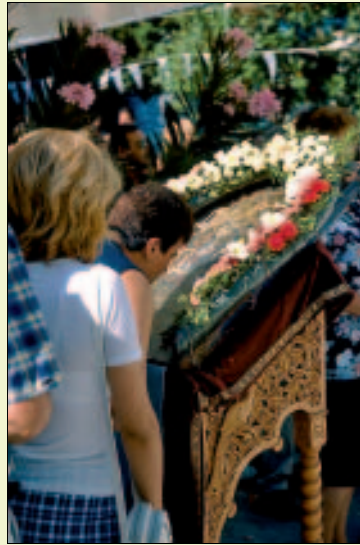
Das Küssen der Marienikone gehört dazu

Am nächsten Morgen scheint ganz Panagía, vielleicht aber auch halb Thásos auf den Beinen zu sein. Alles strömt Richtung Kirche, um die vor dem Gebäude ausgestellte, mit Blumen geschmückte Marienikone zu küssen und eine Kerze anzuzünden. Währenddessen liest der Pope im proppvollen Innern die Messe, unterstützt von den beiden Psáltes, die unermüdlich die liturgischen Gesänge beisteuern. Bald hat sich auch der Vorplatz gefüllt, und um sich die Zeit des Wartens zu verkürzen, kauft man an den Ständen ein, hält ein Schwätzchen mit Bekannten oder raucht eine Zigarette. Wenn jedoch der Pope aus der Kirche herauskommt und die Ikone in beide Hände nimmt, ändert sich die Stimmung schlagartig. Angeführt von Blasmusik spielenden Pfadfindern, zieht die Menge hinter dem die Ikone tragenden Popen schweigend durchs Dorf zur Platía hinab, wo der Geistliche eine kurze Liturgie hält. Anschließend wird die Gottesmutter wieder in die Kirche zurückgebracht, doch auf diesem Weg begleiten sie schon nicht mehr so viele. Stattdessen füllen sich blitzschnell die Kafenia, bald, obwohl es kaum 12 Uhr ist, auch die Tavernen, und bei einem guten Essen wird die Panagía in Panagía weiter gefeiert.