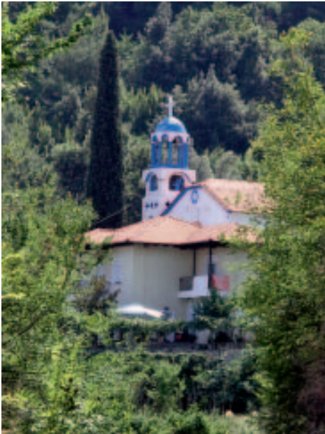
Die Kirche Agí Anárgiri von Potamiá

Zur Fortsetzung der Tour wandert man von WP 11 auf der Dorfstraße ca. 130 m in östliche Richtung bis zur nächsten markanten Kreuzung (WP 12). Schräg gegenüber der Bushaltestelle zweigt man hier in eine steil aufwärts führende Gasse nach links ab. Kurz darauf hält man sich an einer Gabelung (WP 13) links, unmittelbar danach rechts und wandert auf einem schmalen Pfad aus dem Dorf hinaus. Bei den letzten Häusern weist ein Schild mit der Aufschrift „Panagía“ nach rechts. Auf einem rot markierten, aber doch z. T. recht überwachsenen Weg wandert man durch den Wald oberhalb der Golden-Beach-Bucht weiter. 600 m nachdem man einen Waldweg gekreuzt hat (WP 14), passiert man die unscheinbare Kapelle des heiligen