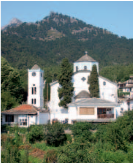
Hinter der Marienkirche erhebt sich der mächtige Profitis-Ilias-Berg

Ausgangspunkt für einen Rundgang ist natürlich die Platía , das Zentrum von Panagía. Kaum einer kommt hier an dem stets rauschenden Dorfbrunnen vorbei, ohne eine Hand voll frisches Wasser getrunken zu haben. Von hier aus folgt man dem Schild „Pros Naós Kim. Theotókou“ in eine sich in Kurven den Hang hinaufwindende Straße, sicherlich eine der malerischsten des Dorfes, und erreicht nach ca. 5 Minuten die 1831 errichtete Marienkirche . Ganz im inseltypischen Stil erbaut, fügt sie sich nahtlos in das Bild des Dorfes ein. Durch einen Rosengarten mit kleinem Teich gelangt man zum Eingang, dahinter liegt der Gemeindefriedhof. Obwohl der Glockenturm nicht besonders hoch ist, hat man von oben doch einen schönen Blick auf die Schieferdächer von Panagía. Im dreischiffigen Kircheninneren lohnt die gewaltige Holzikonostase mit dem Auge Gottes im Giebel ein genaueres Betrachten. An der rechten Seite des Mittelschiffs, dem Bereich