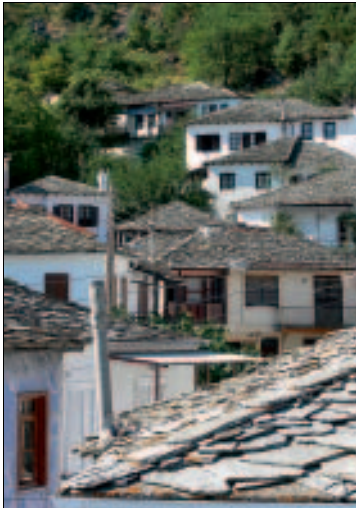
Damals wie heute: In Panagía baut man traditionell

Pension Chrissáfis (2) , in dem grün bewachsenen Haus an der Hauptstraße werden ganzjährig 12 vor kurzem gründlich