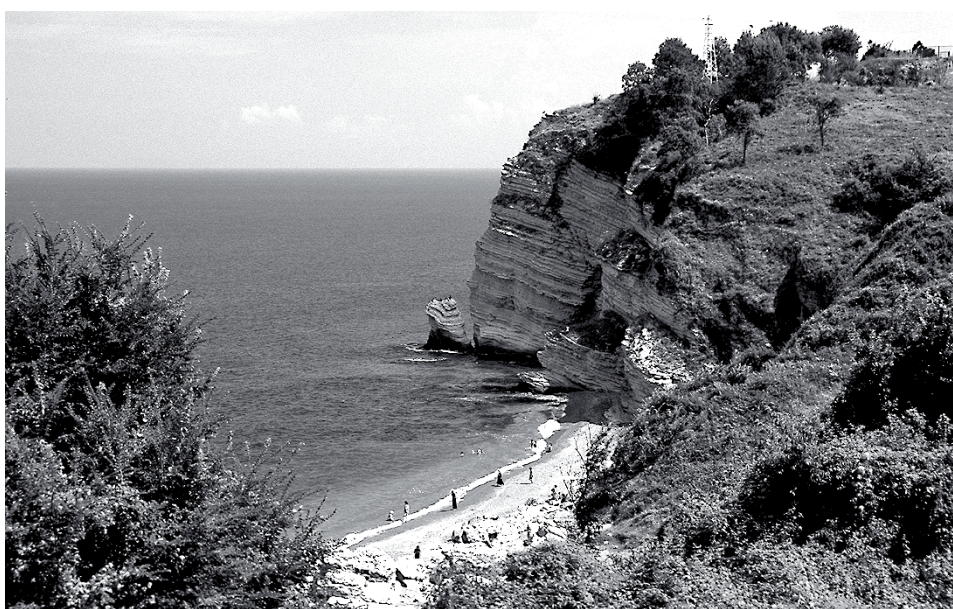
Akçakoca: Strand im Schatten der Burg